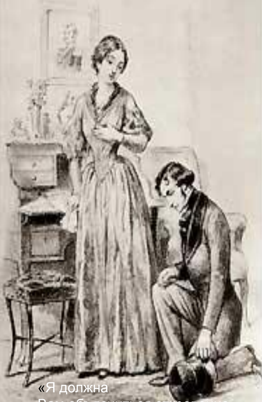
«Я должна Вам объяснить откровенно»