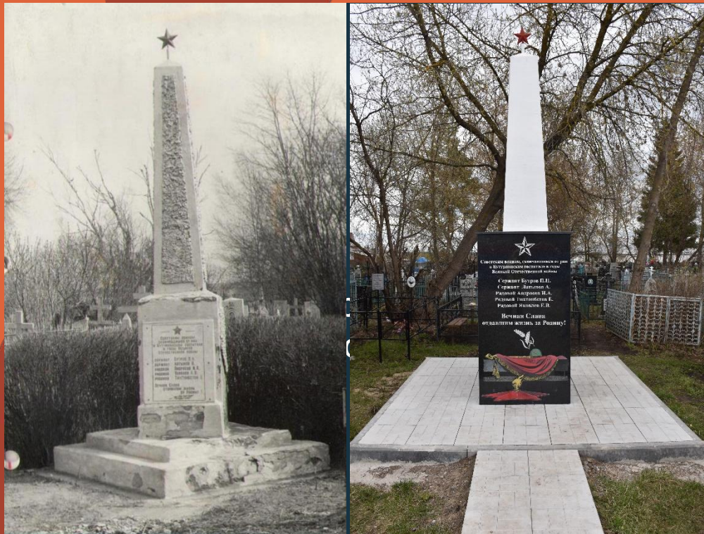
Памятник советским воинам, скончавшимся от ран в Бутурлинском госпитале в годы Великой Отечественной войны, расположенный на кладбище р.п. Бутурлино.

Несмотря на хороший уход, тяжелораненые бойцы умирали. Умершие от ран в Бутурлинском госпитале защитники Родины похоронены в Братской могиле на кладбище р.п. Бутурлино. Из воспоминаний медсестер, работавших в госпитале, стало известно, что в братской могиле захоронено больше бойцов, умерших от ран в госпитале, чем указано в списках.