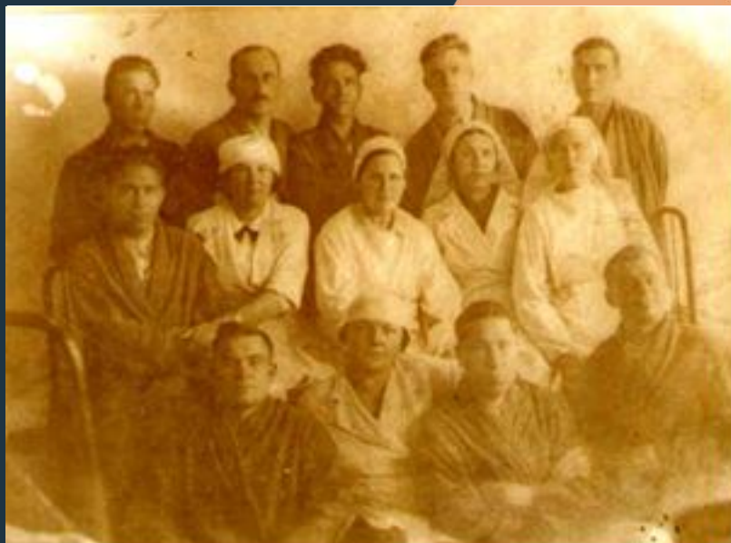
Фотокопия. Коллектив врачей Бутурлинского эвакогоспиталя с выздоравливающими фронтовиками

Врачебные кадры были укомплектованы старшим хирургом -с 19-летним стажем, врачом начальником отделения с 2х летним стажем, врачом терапевтом с 10 летним стажем и одна врачебная должность замещена не была.