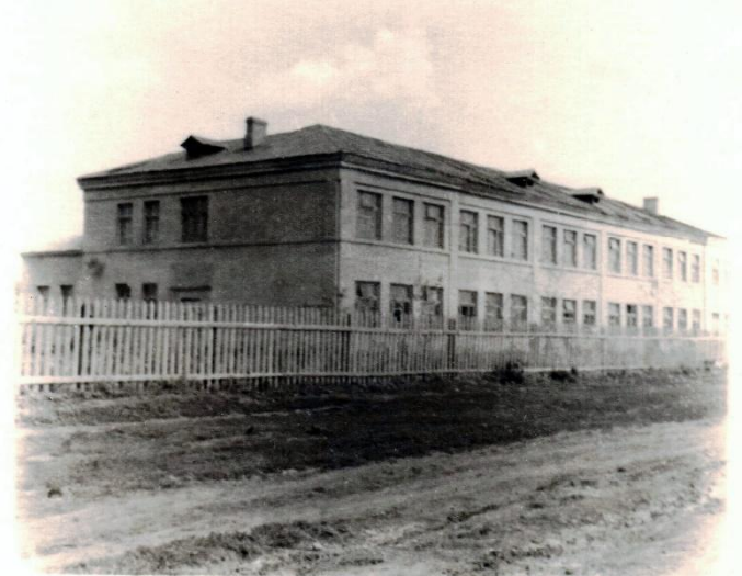
Бутурлинская школа в период Великой Отечественной войны

«Помещение нашей школы занял госпиталь в войну»