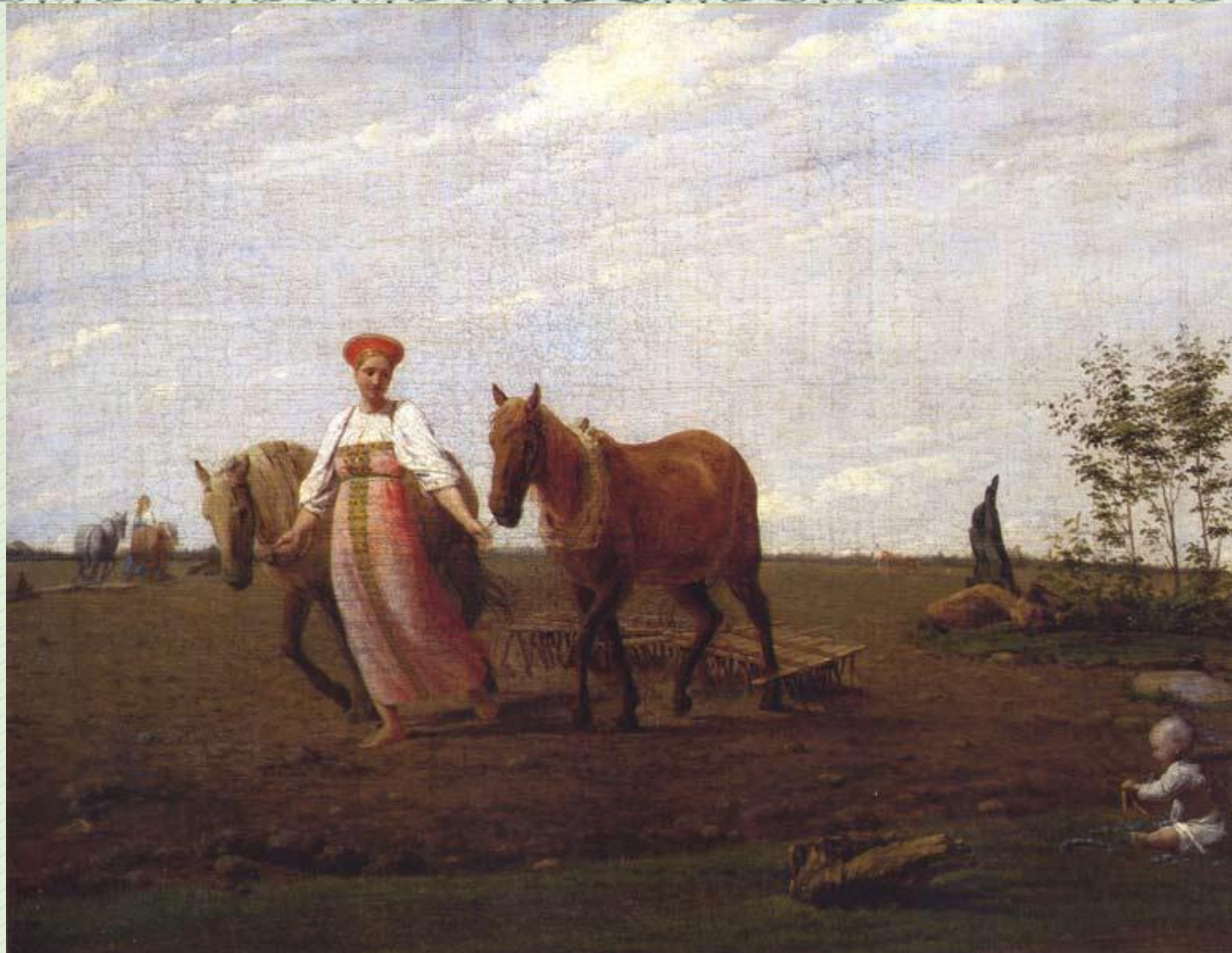
А.Г. Венецианов "На пашне.Весна"