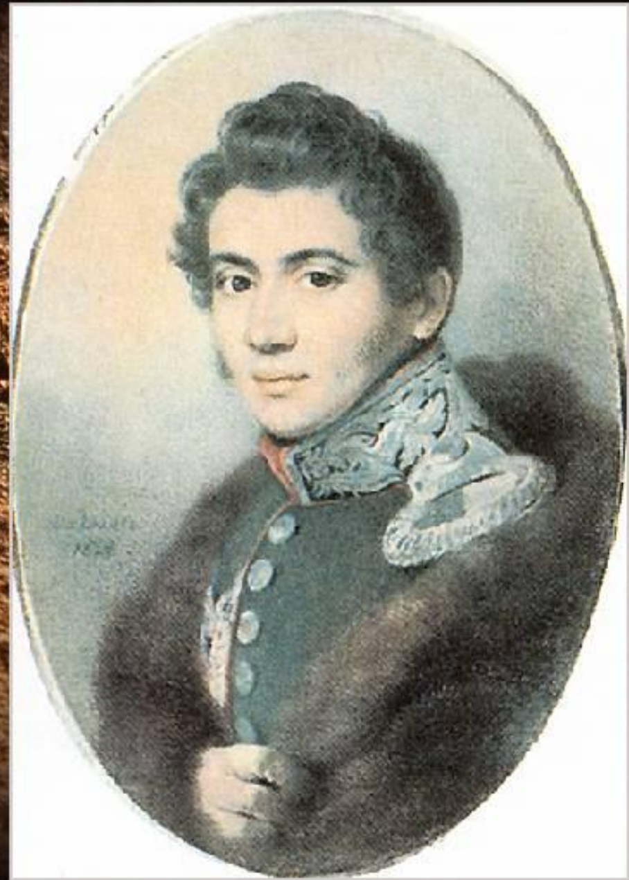
Муравьев Н.М. (1795-1843)

Никита Михайлович Муравьев - декабрист, член Северного общества, автор проекта Конституции. Проект предусматривал введение в России демократических свобод, учреждение конституционной монархии, отмену крепостного права.