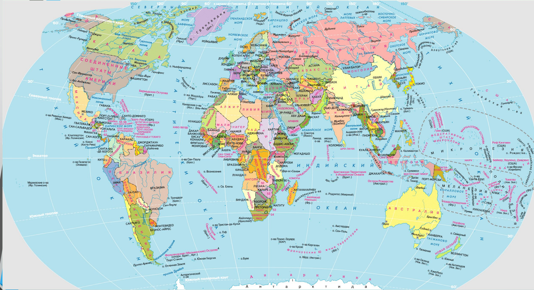
ЦИФРАМИ НА КАРТЕ ОБОЗНАЧЕНЫ ГОСУДАРСТВА И ТЕРРИТОРИИ