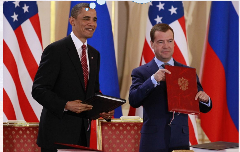
Подписание СНВ-3 в Праге, 2010 г.