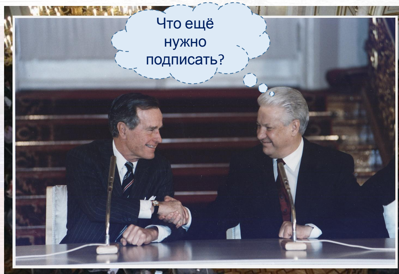
Подписание договора СНВ-II в Кремле, 1993 г.