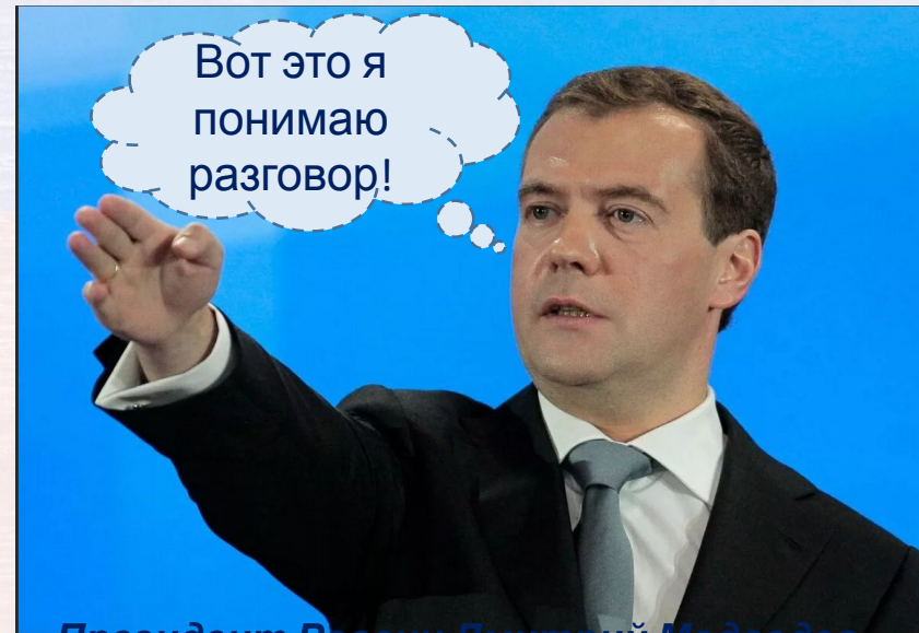
Президент России Дмитрий Медведев