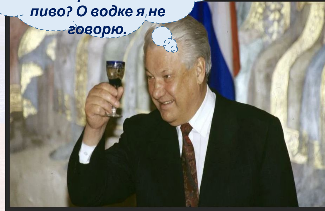
Президент РФ Борис Ельцин

Это все хорошо... Но разве российский шоколад хуже импортного? А пиво? О водке я не говорю.