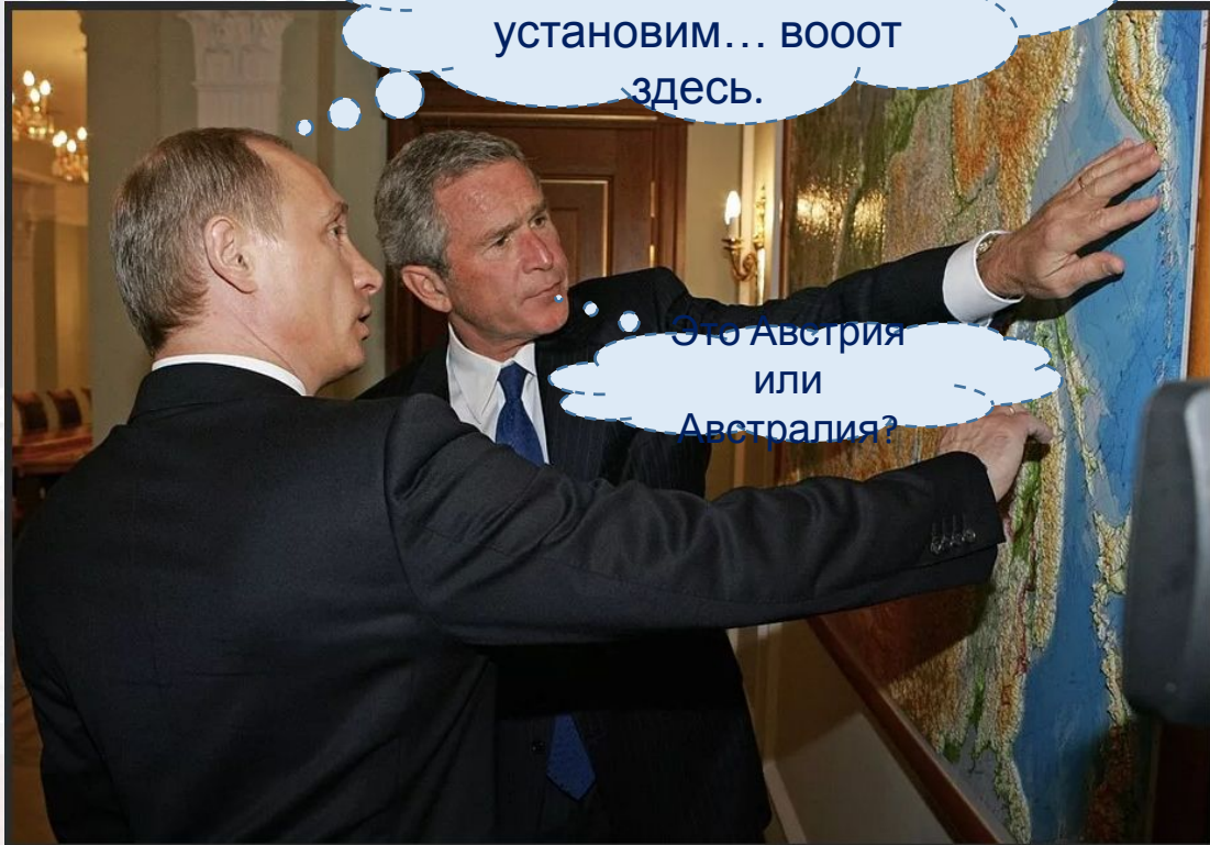
Джордж Буш-мл. и Владимир Путин