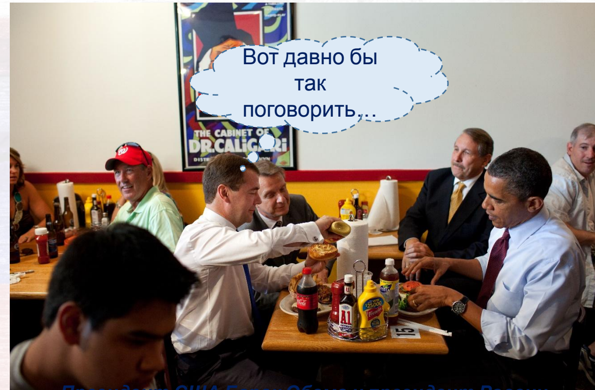
Президент США Барак Обама и президент России Дмитрий Медведев обедают в ресторане Ray's Hell Burger в Арлингтоне, штат Вирджиния., 2010 г.