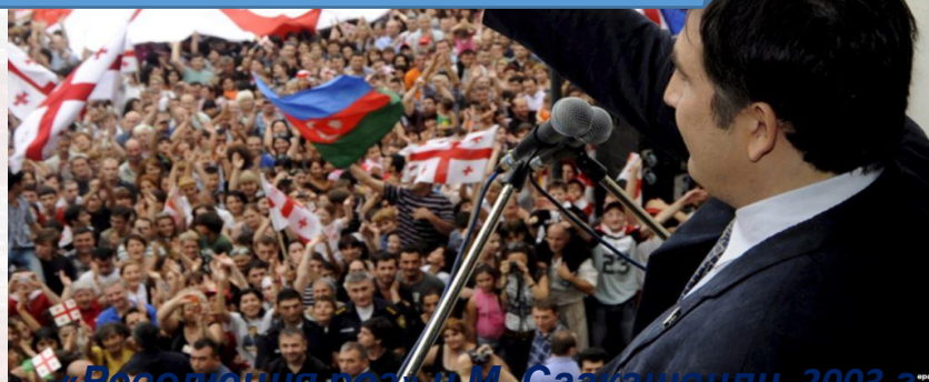
«Революция роз» и М. Саакашвили, 2003 г.

США стали восприниматься в России как сила, стремящаяся «выдавить» РФ с прилегающих к ней территорий и использовать их как плацдарм для изменения политического строя РФ.