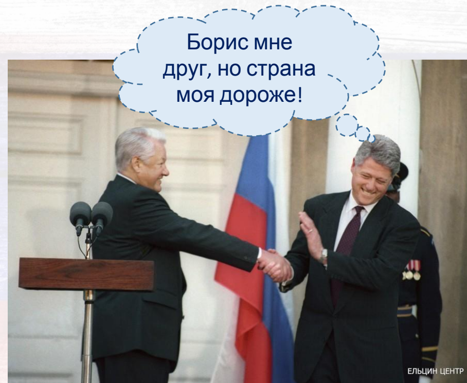
Борис Ельцин и Билл Клинтон, 1999 г.