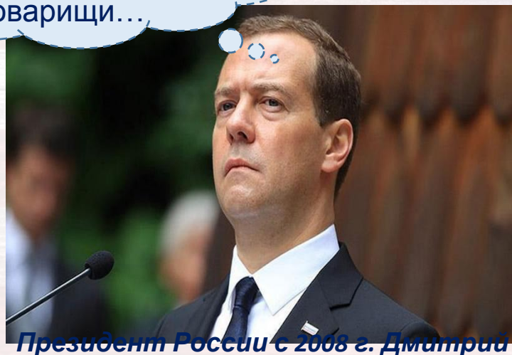
Президент России с 2008 г. Дмитрий