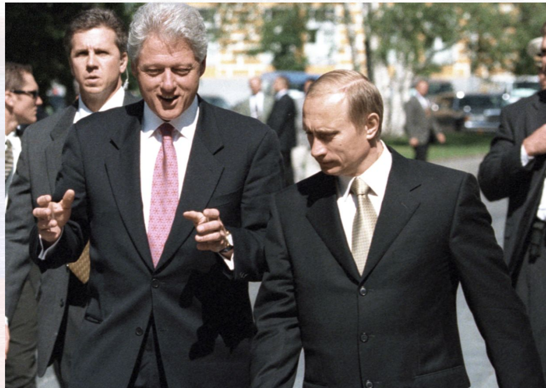
Президент Билл Клинтон и президент России Владимир Путин, 2000 г.

Россия и США заинтересованы в укреплении ДНЯО, и в этом смысле их интересы совпадают. Но российская сторона осторожно нащупывает альтернативу американской стратегии контрраспространения, и это вызывает раздражение в Вашингтоне.