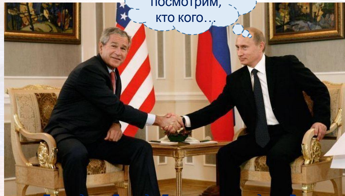
Президент Джордж Буш-мл. и президент России Владимир Путин

↓ ↓ Америка отказывала России в получении статуса равноправного партнёра.