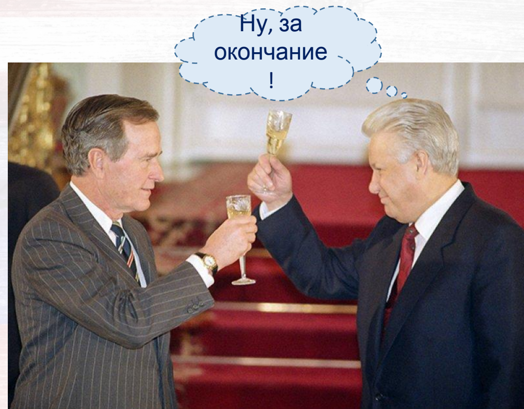
Президенты США и России Джордж Буш и Борис Ельцин