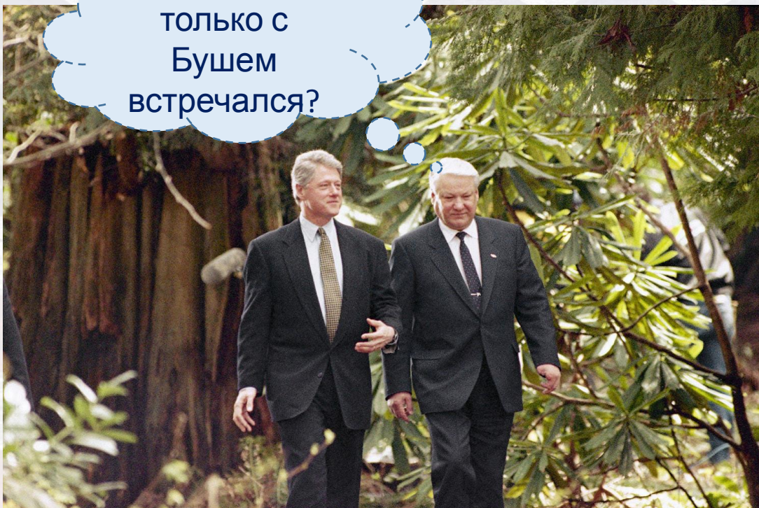
Президенты США и России во время саммита в Ванкувере в 1993 г.