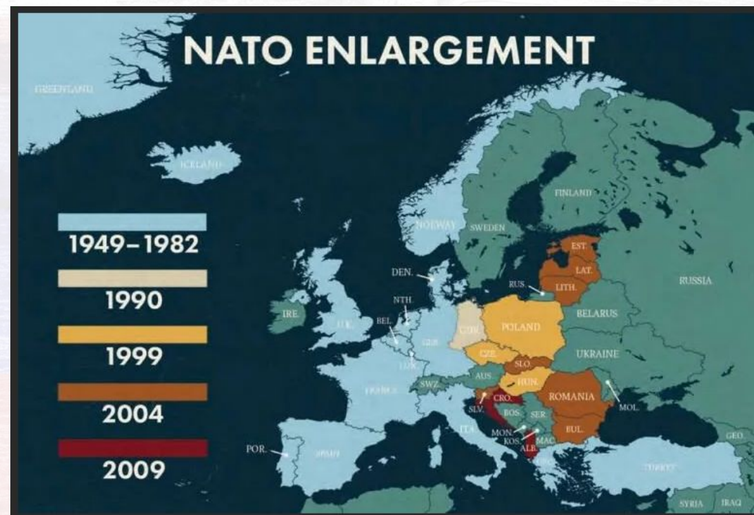
Карта расширения стран НАТО