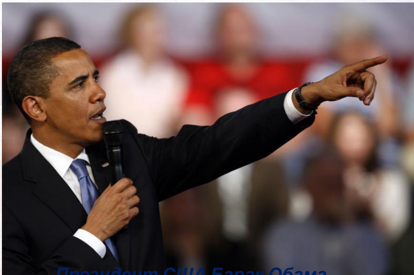
Президент США Барак Обама