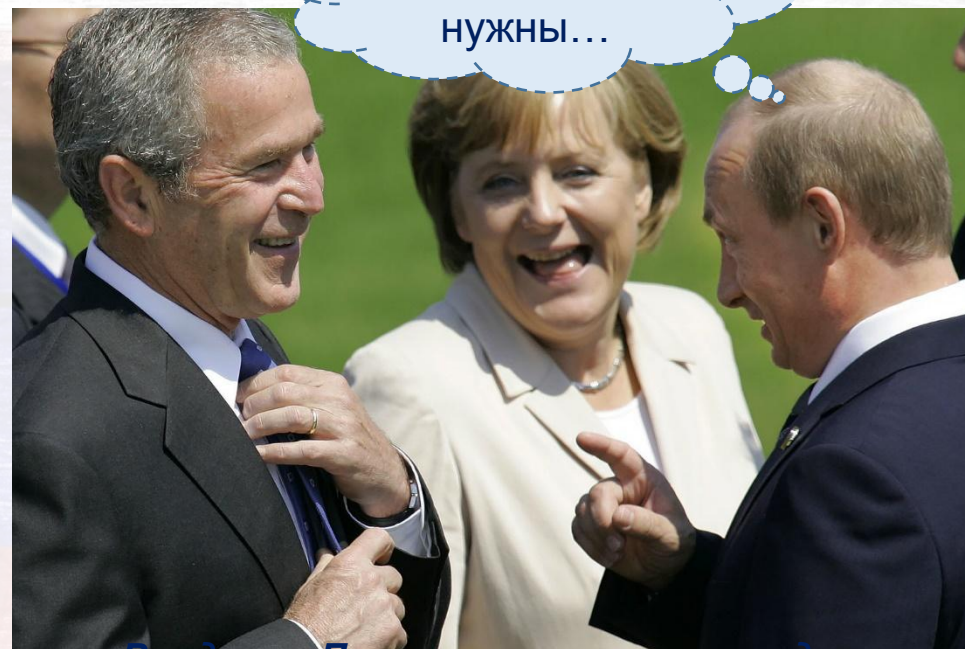
Владимир Путин на встрече с западными лидерами, 2007 г.