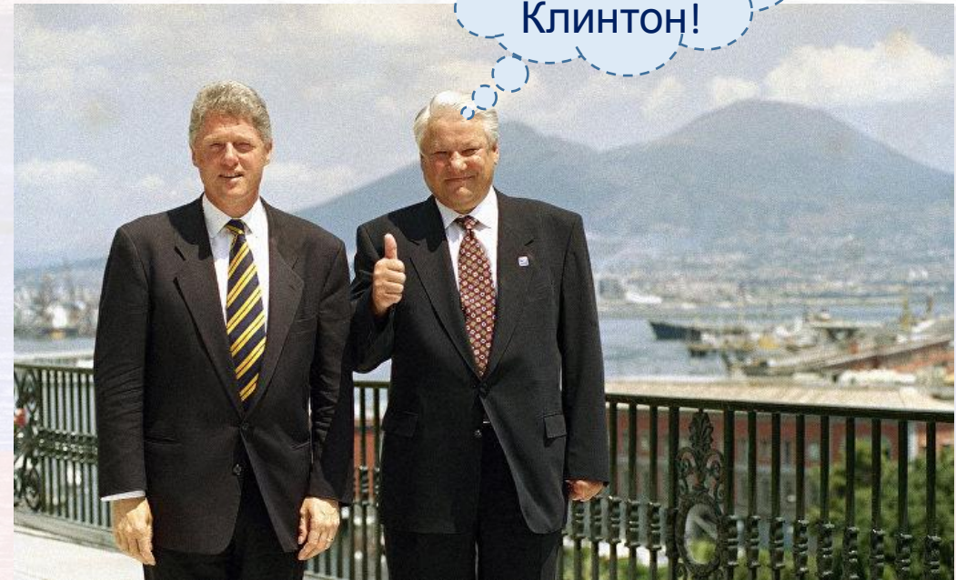
«Друзья» Борис Ельцин и Билл Клинтон

Однако, следом за такой «дружелюбной» характеристикой Клинтон, как бы невзначай, упоминал о пристрастии Ельцина к алкоголю и тут же, применяя примеры из истории.