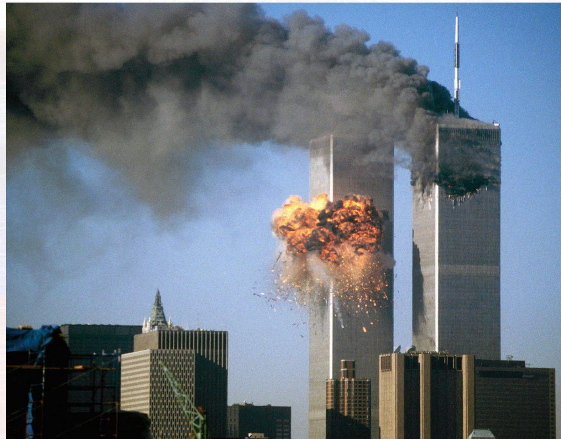
Теракт в Нью-Йорке в здании Всемирного торгового центра, 11 сентября 2001 г.