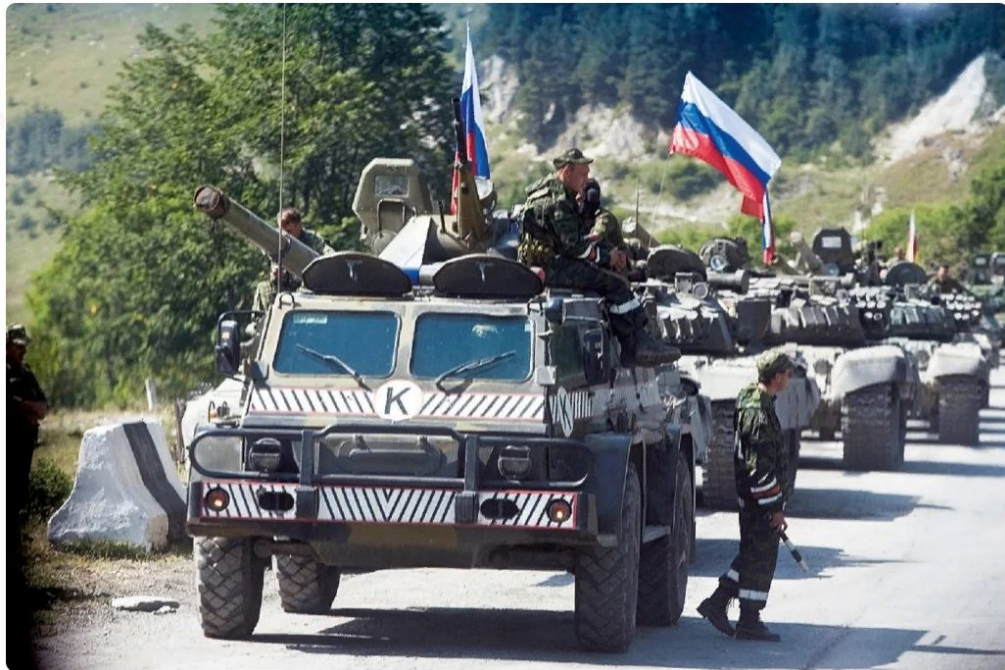
Российская техника на пути в Грузию, 2008 г.