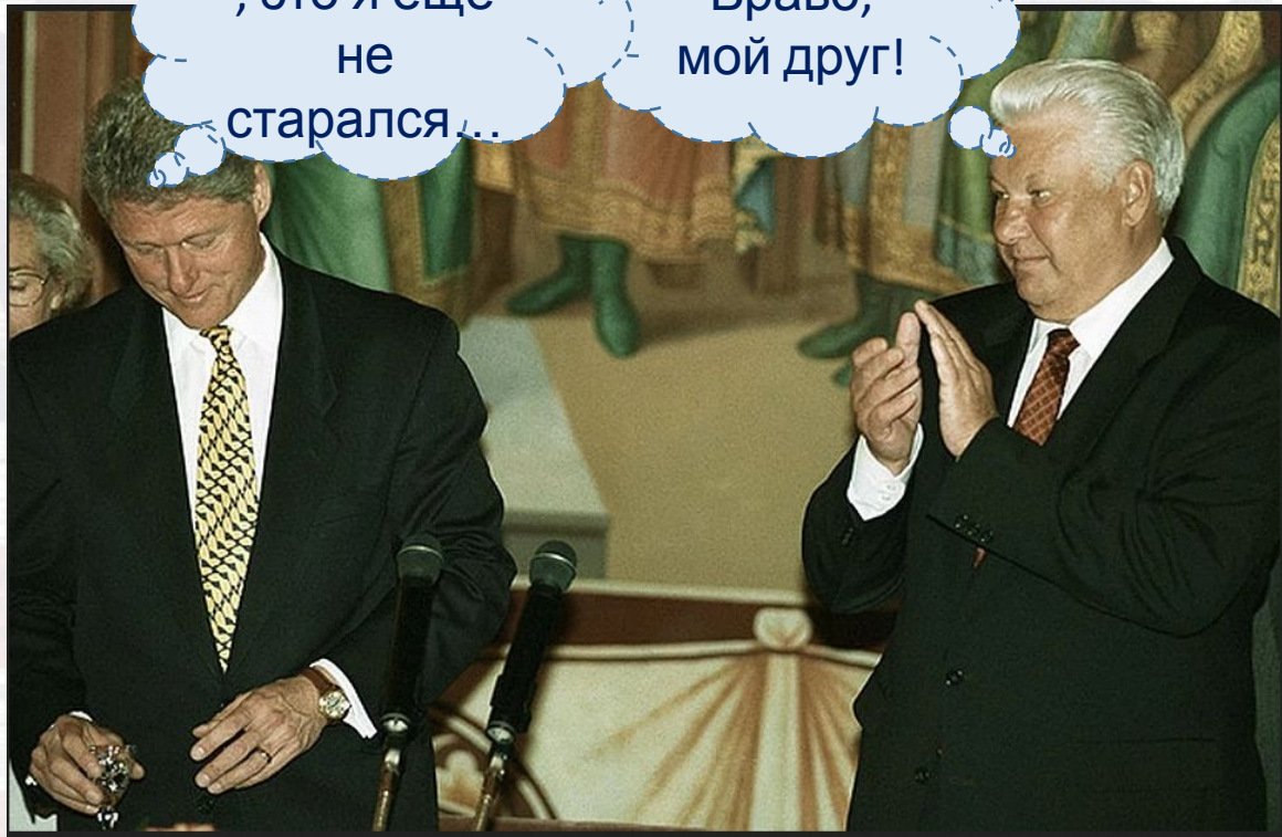
Президент РФ Борис Ельцин приветствует президента США Билла Клинтона в Кремле, 1995 г.