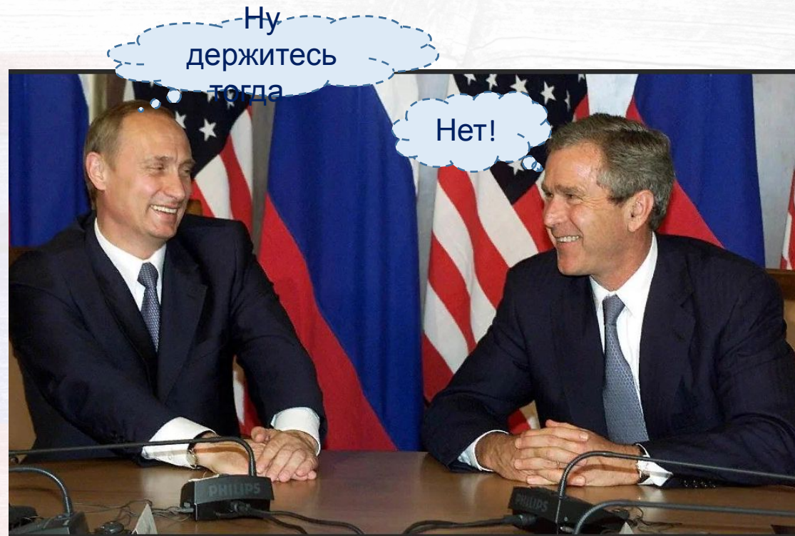
Владимир Путин и Джордж Буш-мл.