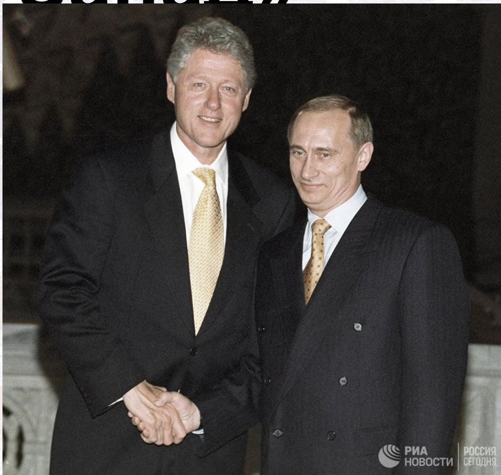
Президент Билл Клинтон и тогда ещё премьер-министр России Владимир Путин, 1999 г.