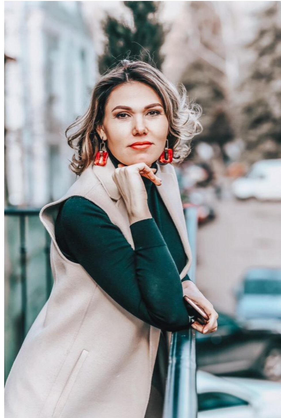
Фото для слайда «Об эксперте»