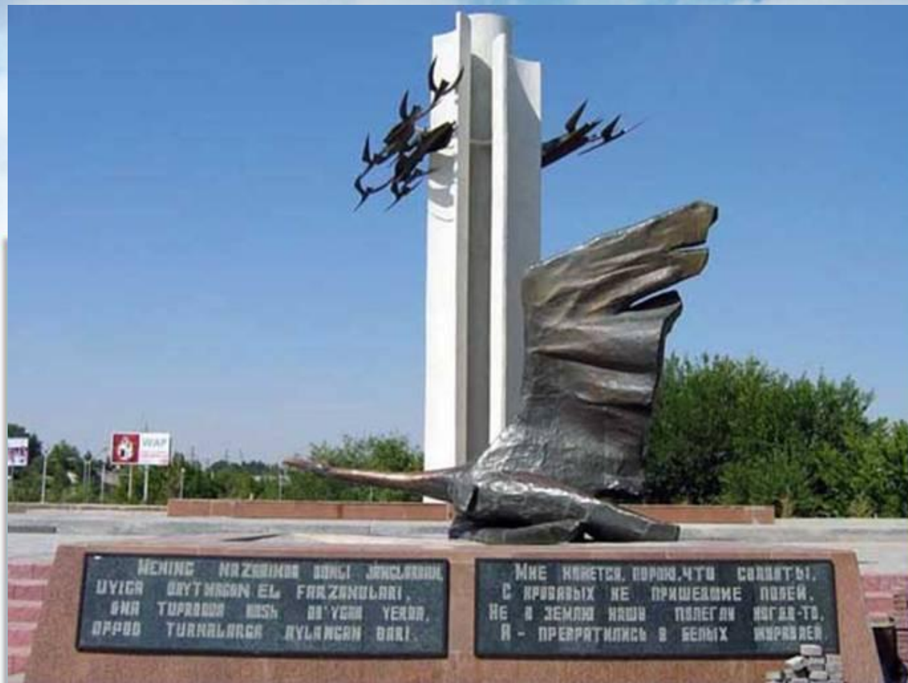
Узбекистан, г. Чирчик