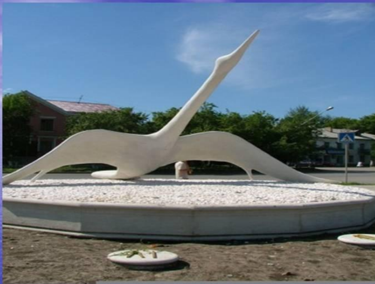
г. Ишим в Тюменской области