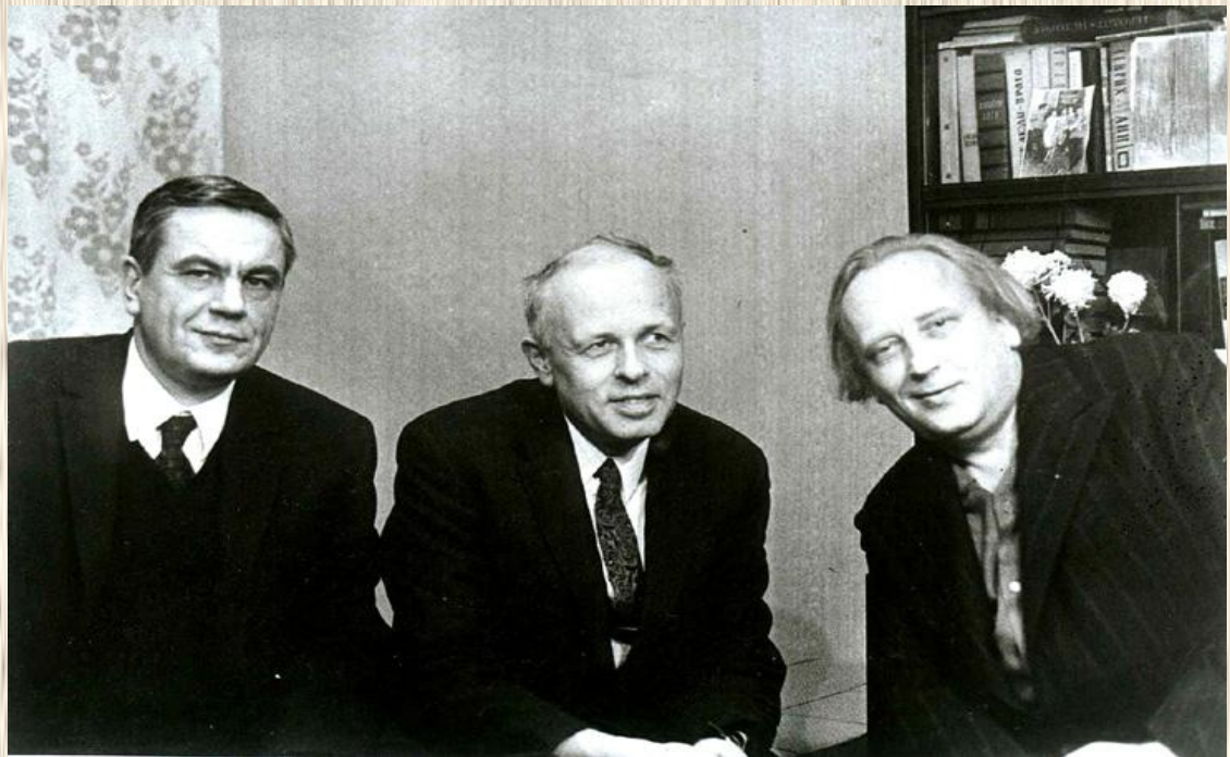
Комитет прав человека И.Г. Шафаревич (слева), А.Д.Сахаров, Г.С.Подъяпольский. Москва, 1973

1970 г., создание первой правозащитной организации - Комитета прав человека в СССР, в состав которого вошли Андрей Сахаров, Александр Солженицын, Александр Галич и др.