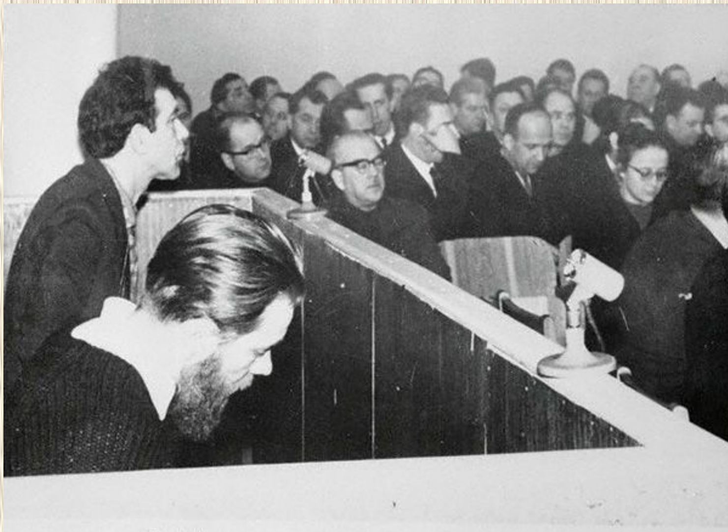
Судебный процесс против писателей А. Д. Синявского и Ю. М. Даниэля