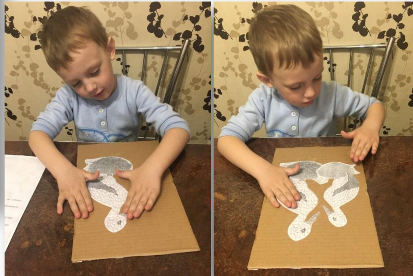
1.2. С помощью ПВА клея наносим трафареты на картон