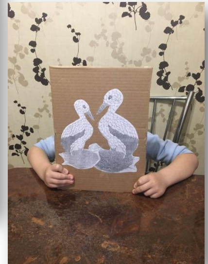
1.3. Эскиз готов к работе