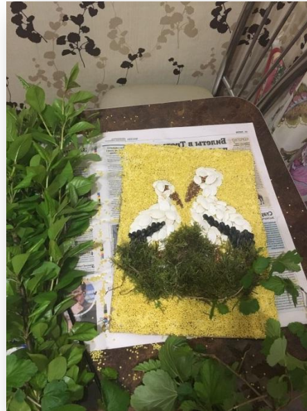
4.2. С помощью клея и веточек обделываем гнездышко