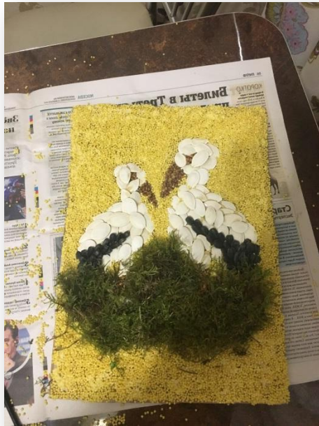
4.1. С помощью клея и мха делаем гнездо