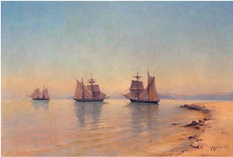
М. А. Алисов, “Морской пейзаж”

Морской пейзаж - Марина, Маринизм — жанр изобразительного искусства, изображающий морской вид, а также сцену морского сражения или иные события, происходящие на море. Является разновидностью пейзажа. В качестве самостоятельного вида пейзажной живописи марина выделилась в начале XVII века в Голландии.