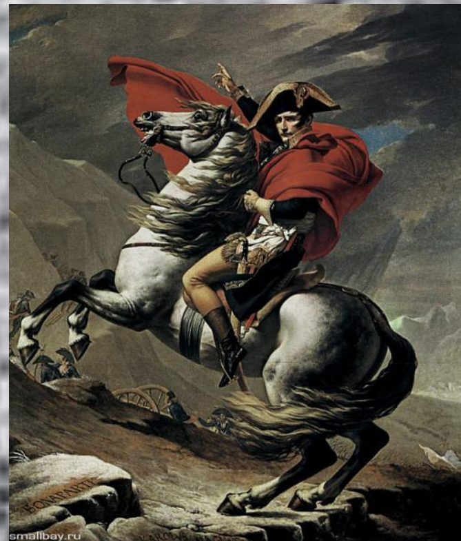
«Наполеон на перевале Сен-Бернард»