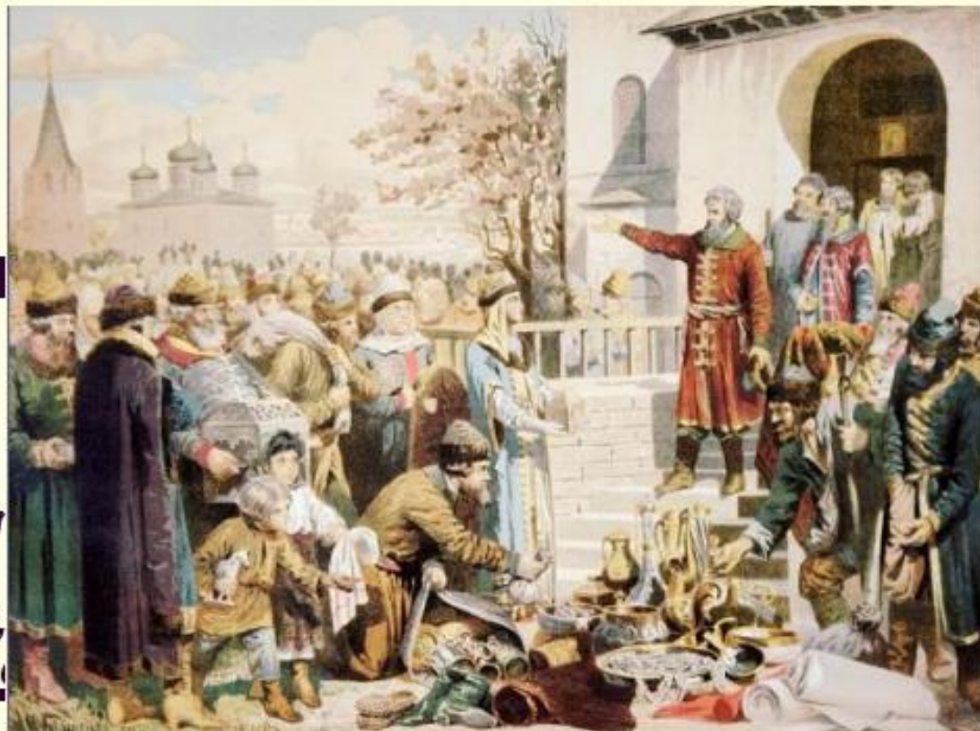
К.Маковский. Минин на площади Нижнего Новгорода, призывающий народ к жертвованиям

Отчизну, родину любя, Нательный крест сними себя!