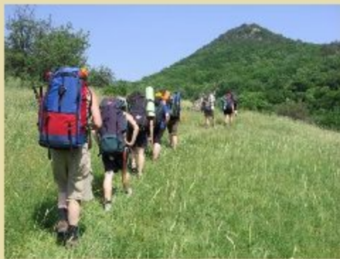
Группа на маршруте.