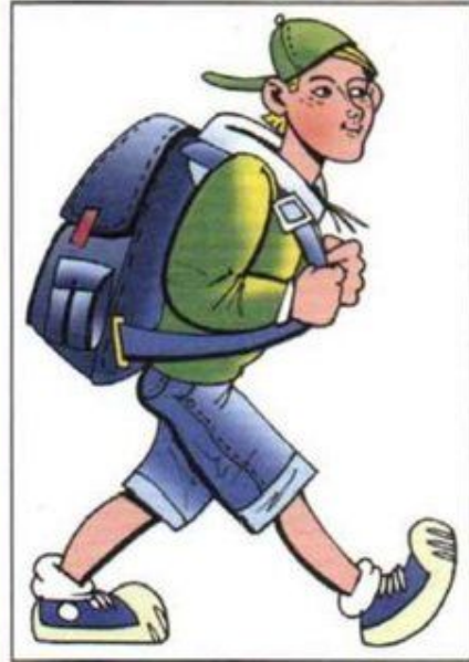
Техника движения в пешем походе на равнинной местности

При ходьбе туловище туриста слегка наклоняется вперед, чтобы уравновесить вес рюкзака.