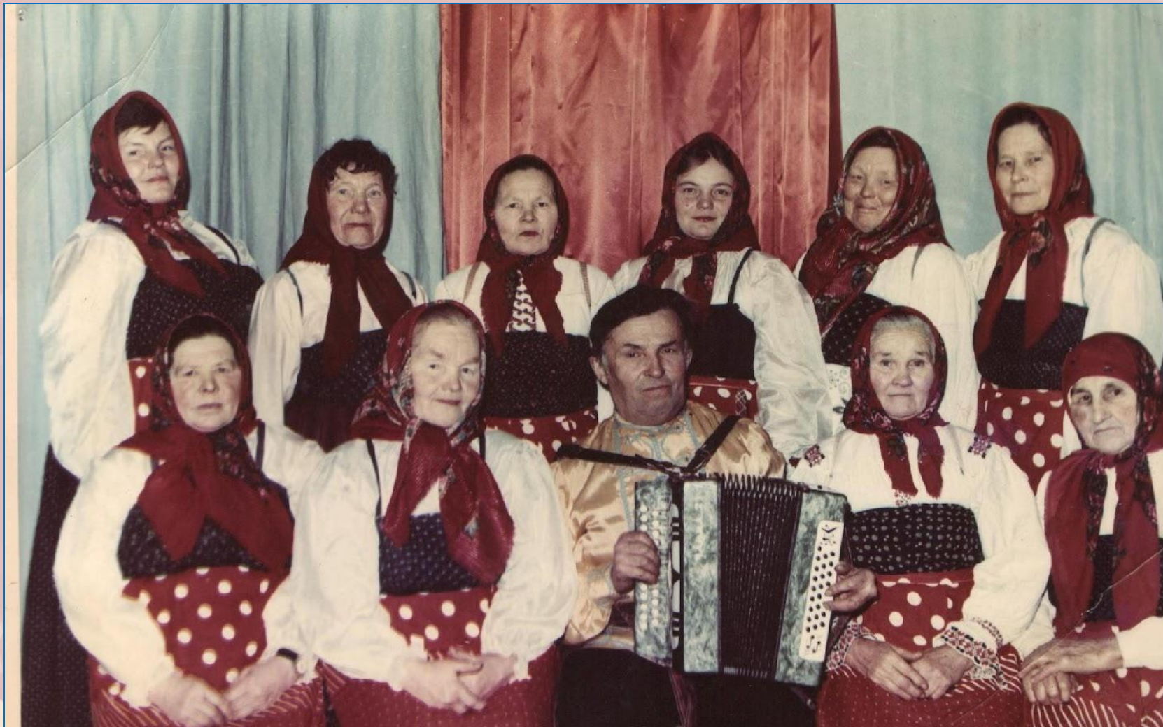
Бессменный участник фольклорного ансамбля «Бичир»