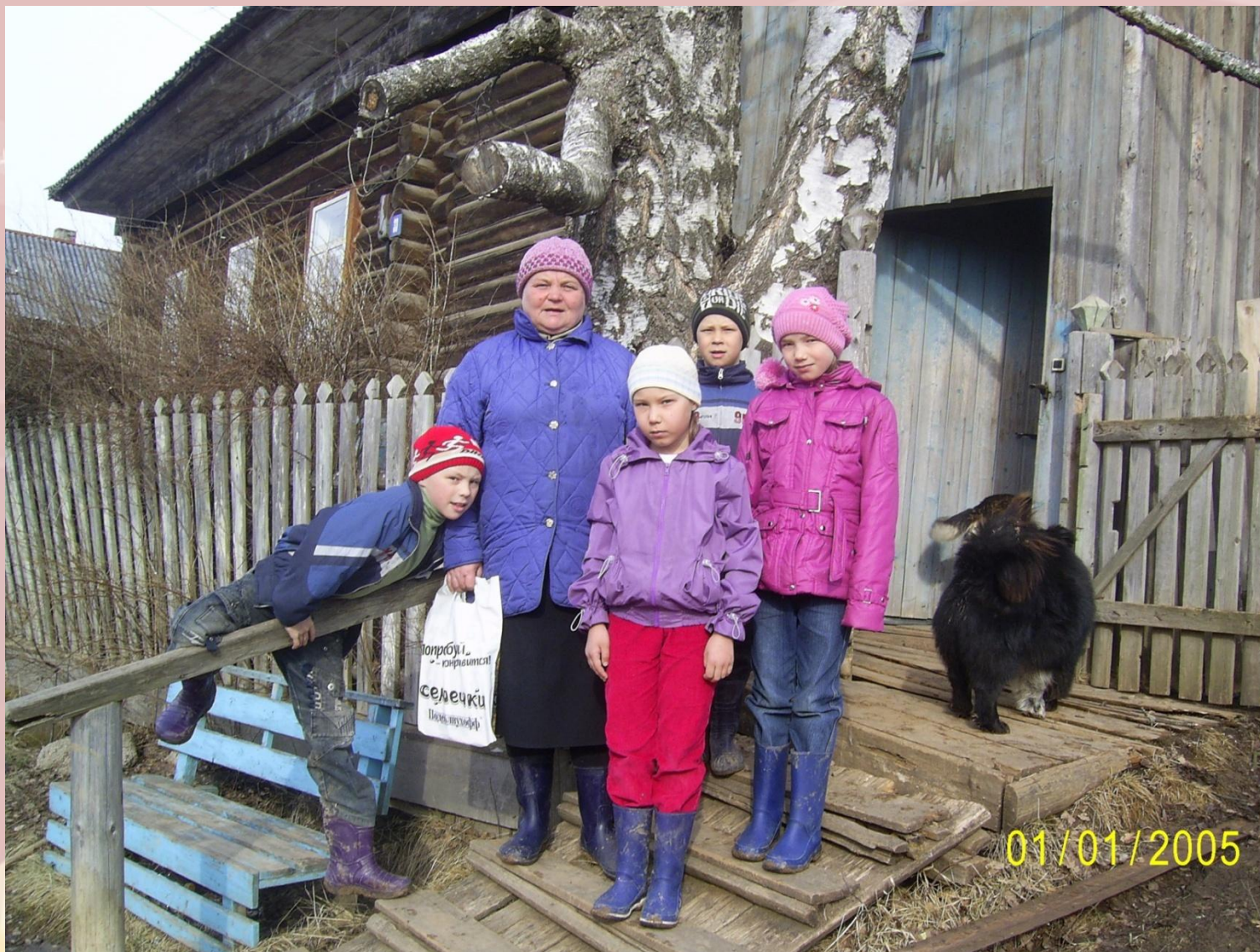
В гости к ветерану