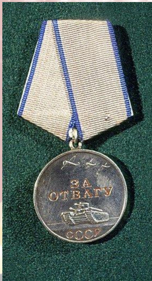
Медаль за отвагу