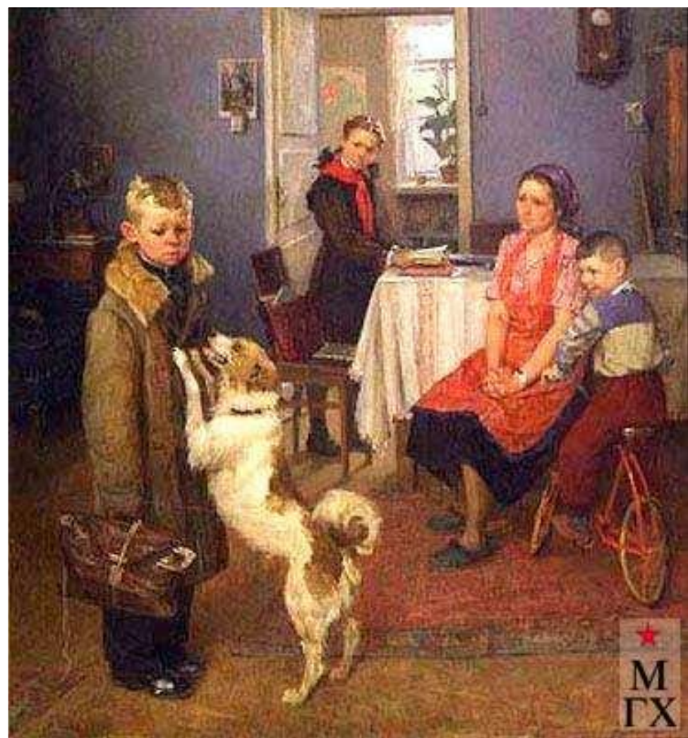
Ф.П. Решетников «Опять двойка»

Эмоции - переживания человека, его настроение в тот или иной момент.