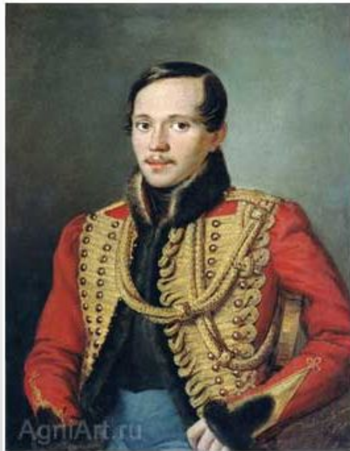
Заболотский П.Е. Портрет поэта М. Ю. Лермонтова. 1837. Из коллекции Третьяковской галереи