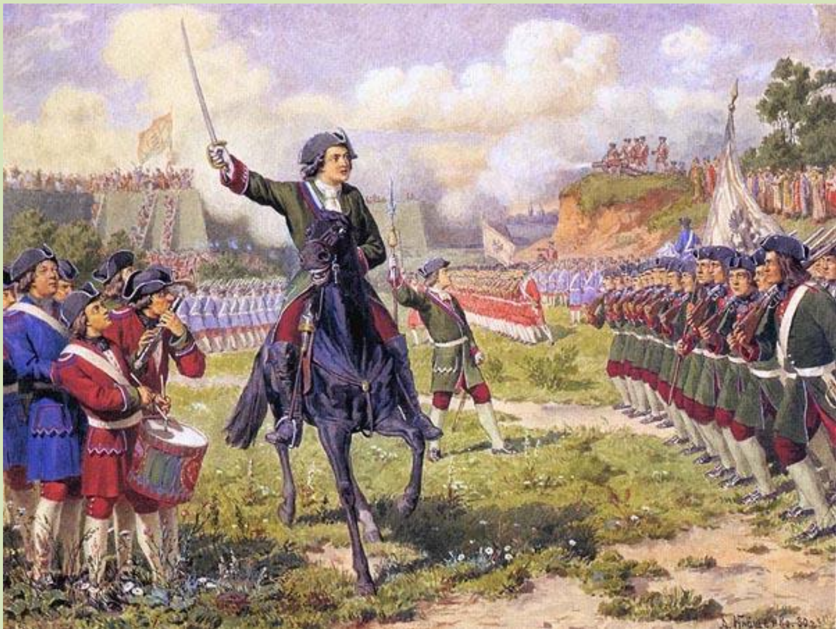
Игры потешных войск Петра I возле села Преображенское