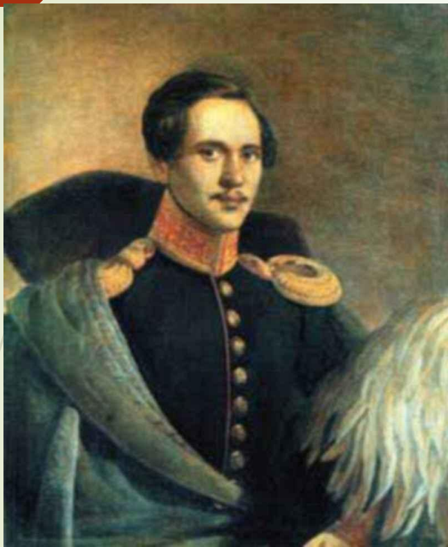
портрет кисти Ф.Будкина