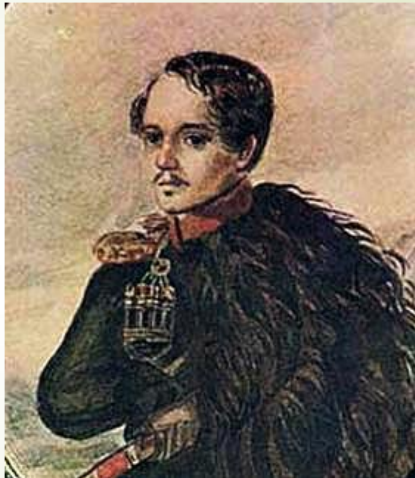
Лермонтов. Автопортрет. Акварель. 1837

Глядя на портреты, мы чувствуем - взгляд поэта неуловим.