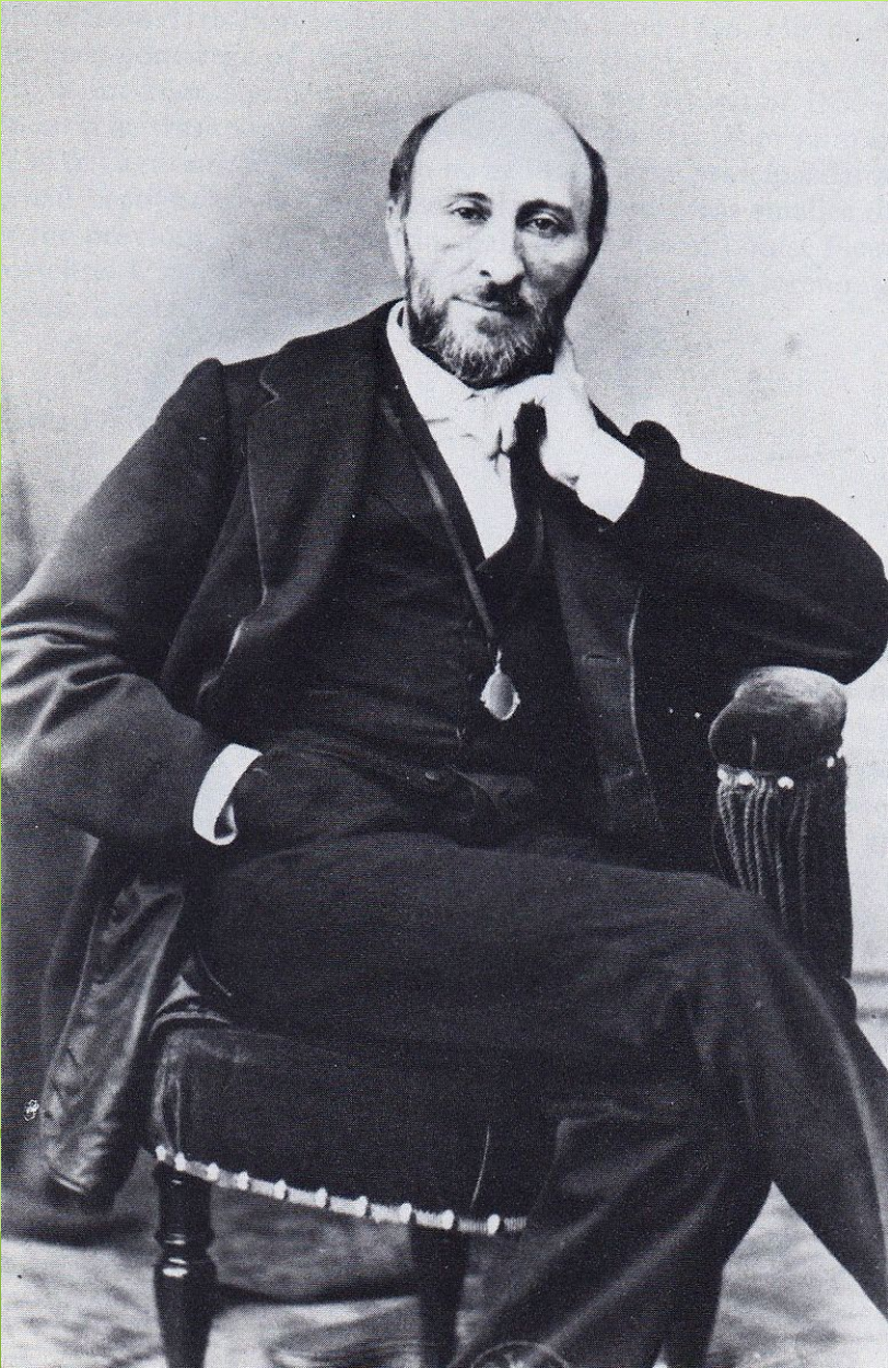
Французский балетмейстер Сен-Леон

□ Пуни широко использовал известные ему русские народные темы, а французский балетмейстер Сен-Леон и вовсе в конце апофеозе балета сделал огромный дивертисмент из 22 танцев народов, населяющих Российскую империю.