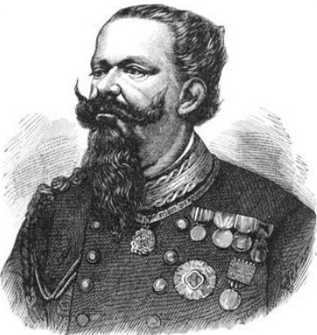
Виктор Эммануил II

Депутаты избирались из 2% жителей страны (мужчин старше 25 лет + имущественный ценз).