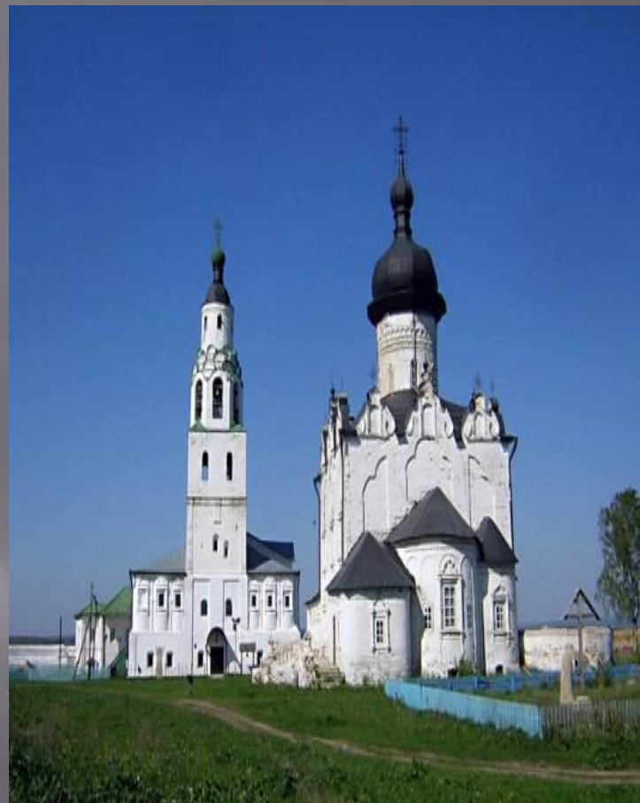
Церковь Сергия Радонежского Иоанно-Предтеченского женского монастыря (1604)