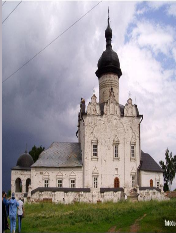
Успенский собор Успенья Пресвятой Богородицы монастыря (1561)