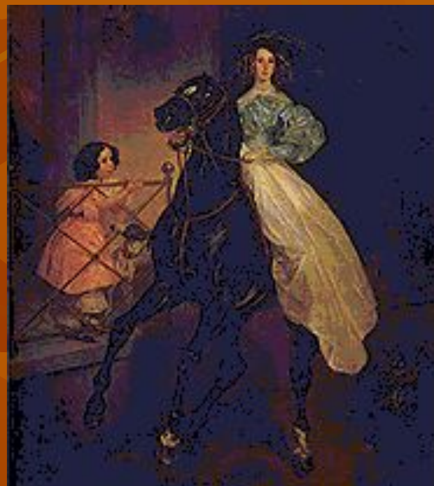
К. П. Брюллов. «Всадница». Портрет Джованины и Амацилии Паччини, воспитаниц гр. Самойловой Ю. П. 1832 г.