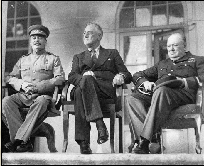
И.В. Сталин, Ф.Д.Рузвельт, У. Черчилль