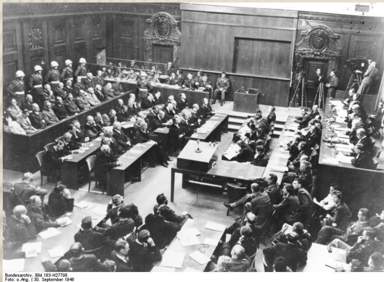
Bild 183-H27798 | 30. September 1946