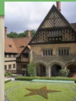
Дворец Цецилиенхоф — место проведения Потсдамской конференции