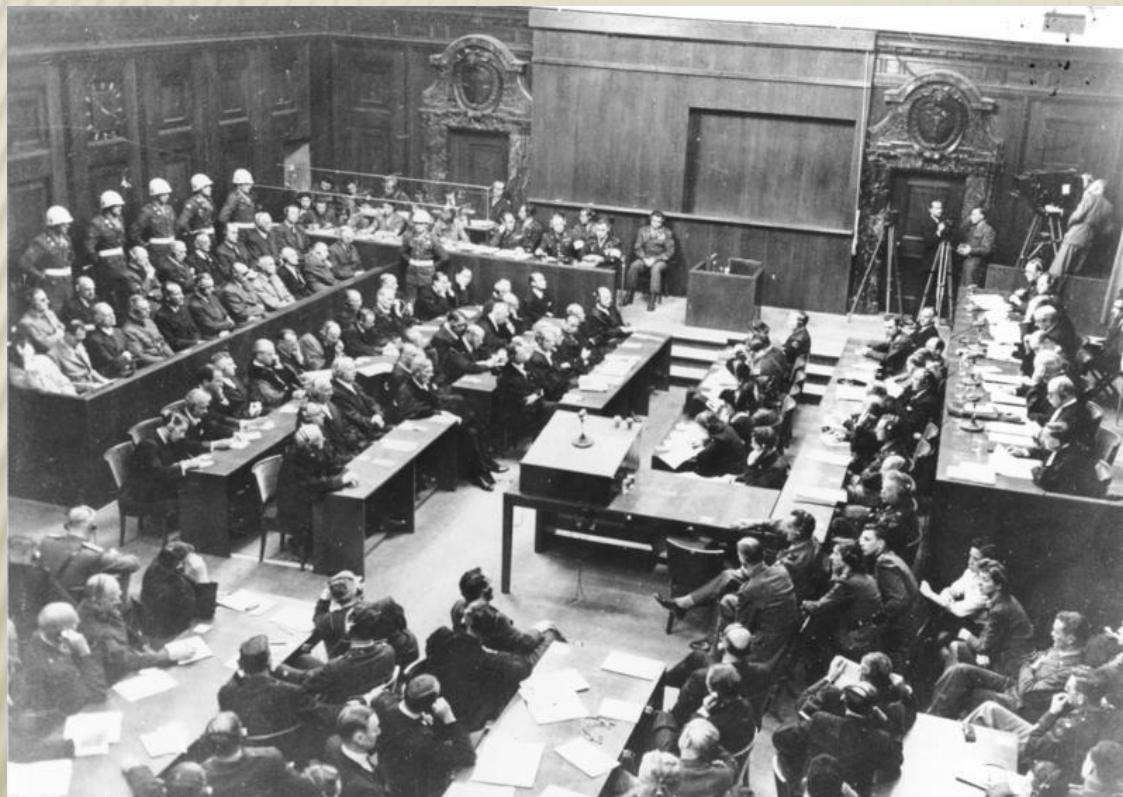
Bundesarchiv, Bild 183-H27798 Foto: o. Ang. | 30. September 1946

Еще в 1942г. лидеры союзных государств заявили о том, что нацистское руководство должно быть судимо международным трибуналом. О создании такого суда было принято решение в Лондоне на совместной конференции (26 июня – 8 августа 1945г.)