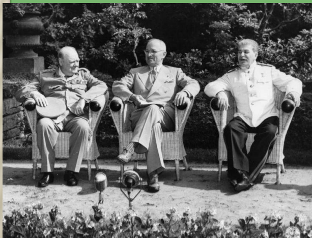
У. Черчилль, Г. Трумен, И. Сталин