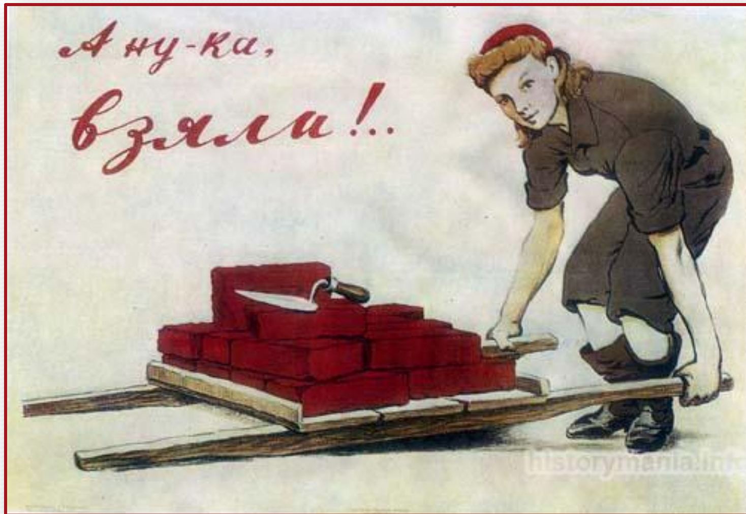
И. А. Серебряный. А ну-ка, взяли!.. 1943г.