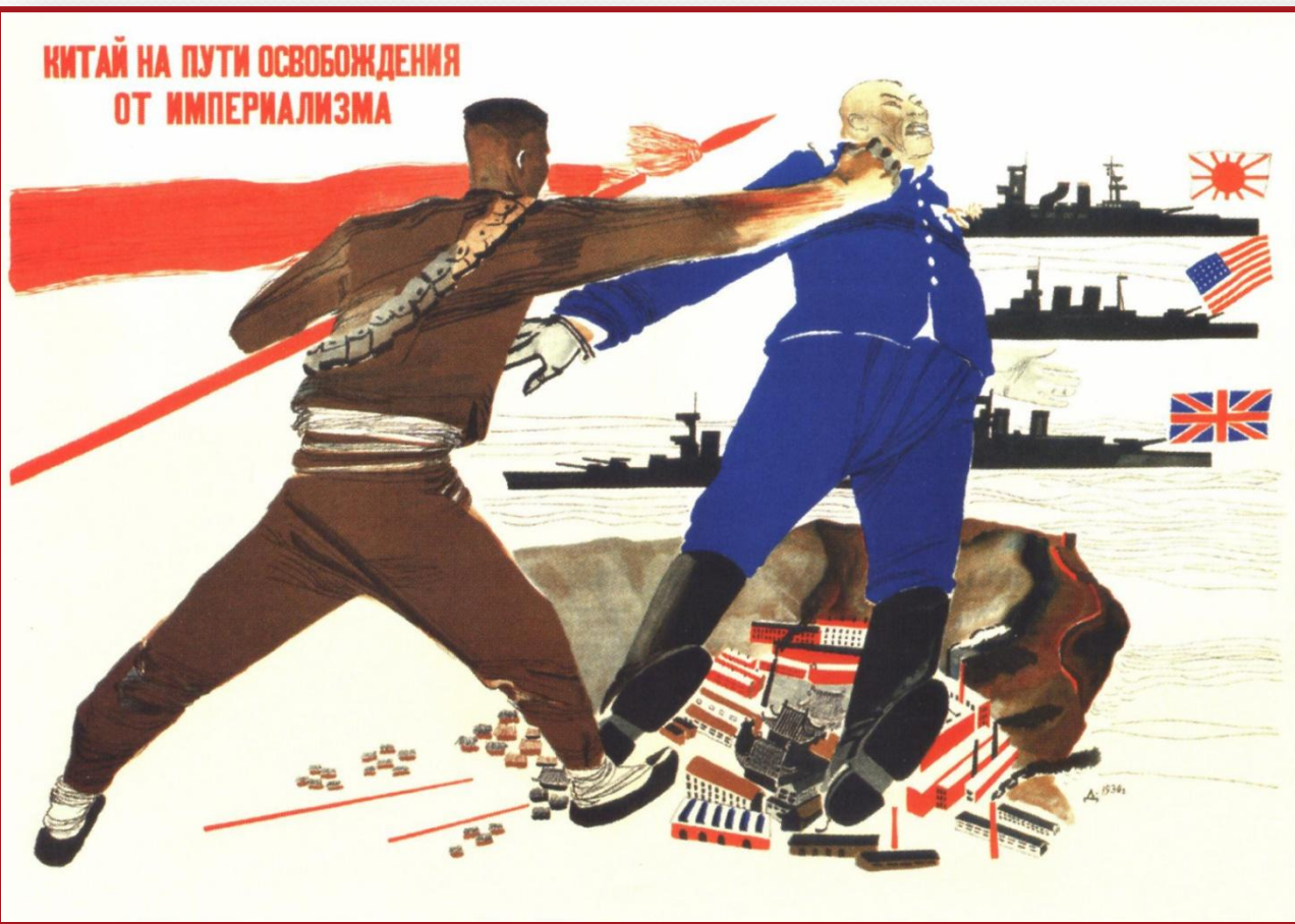
А. А. Дейнека. Китай на пути освобождения от империализма. 1932 г.