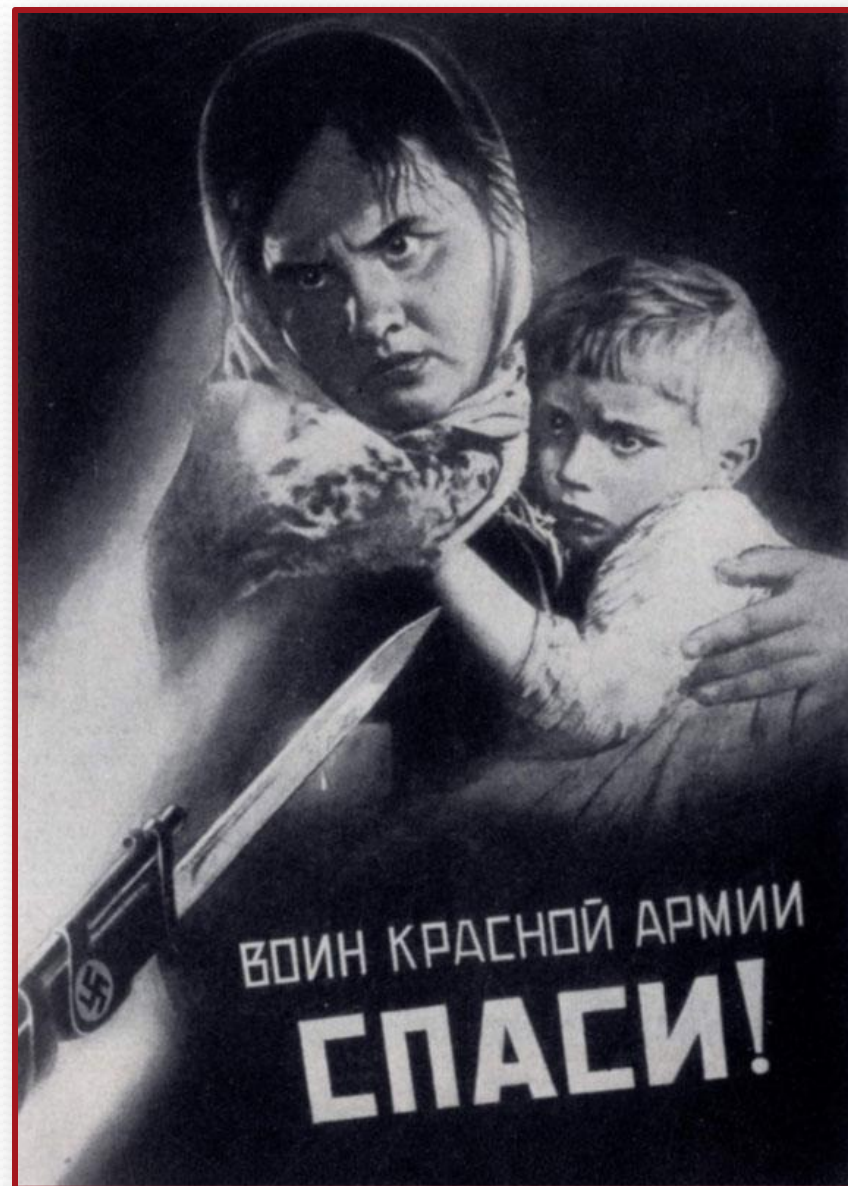
В. Б. Корецкий. Воин Красной Армии, спаси! 1942 г.