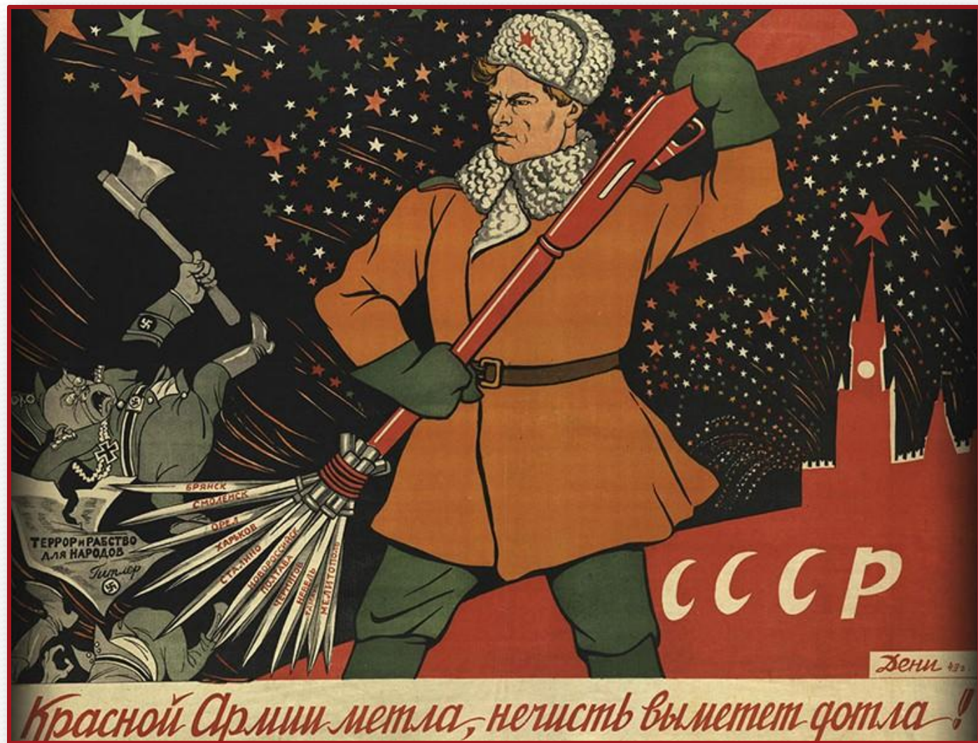
В. Н. Дени. Красной Армии метла Начисть выметет дотла! 1943г.