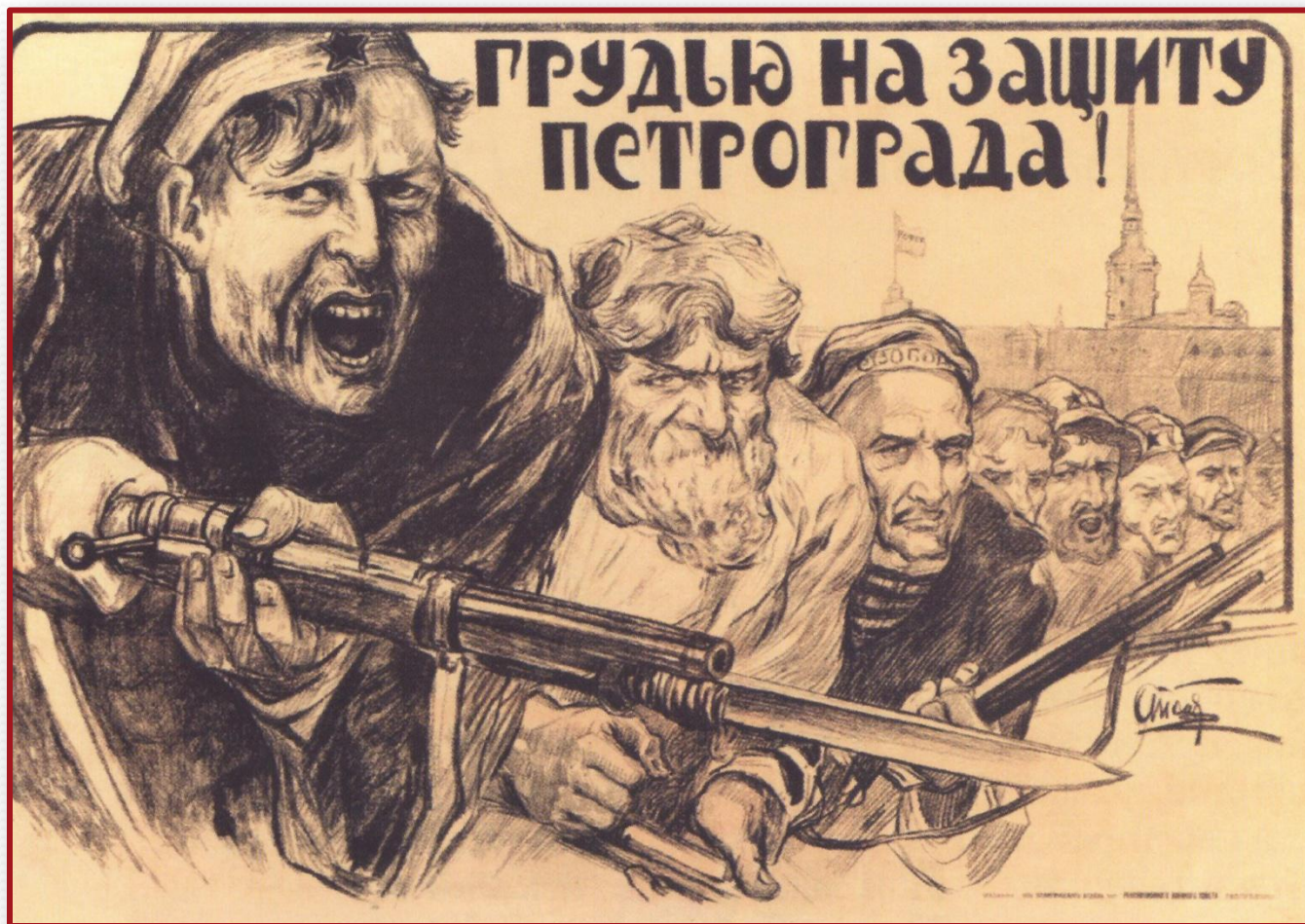
А. А. Аписит. Грудью на защиту Петрограда. 1919 г.