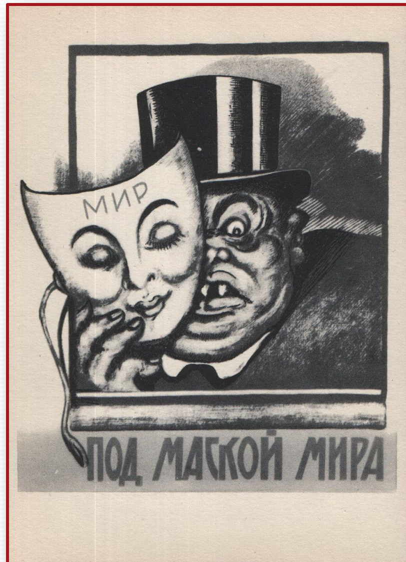
В. Н. Дени. Под маской мира. 1920 г.

Острым юмором и точностью социальной характеристики отмечена лучшая работа В.Н.Дени «Под маской мира»