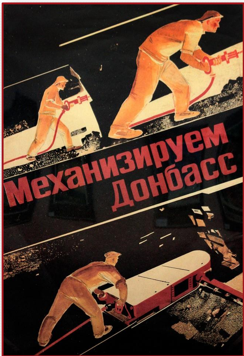
А. А. Дейнека. Механизируем Донбасс. 1930 г.