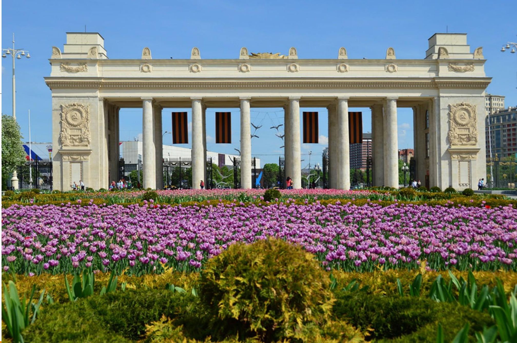
Арка в Парке культуры и отдыха им. М. Горького, Москва