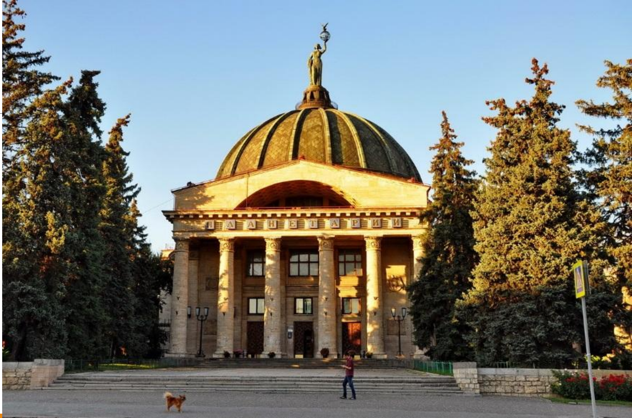
Волгоградский планетарий, Волгоград