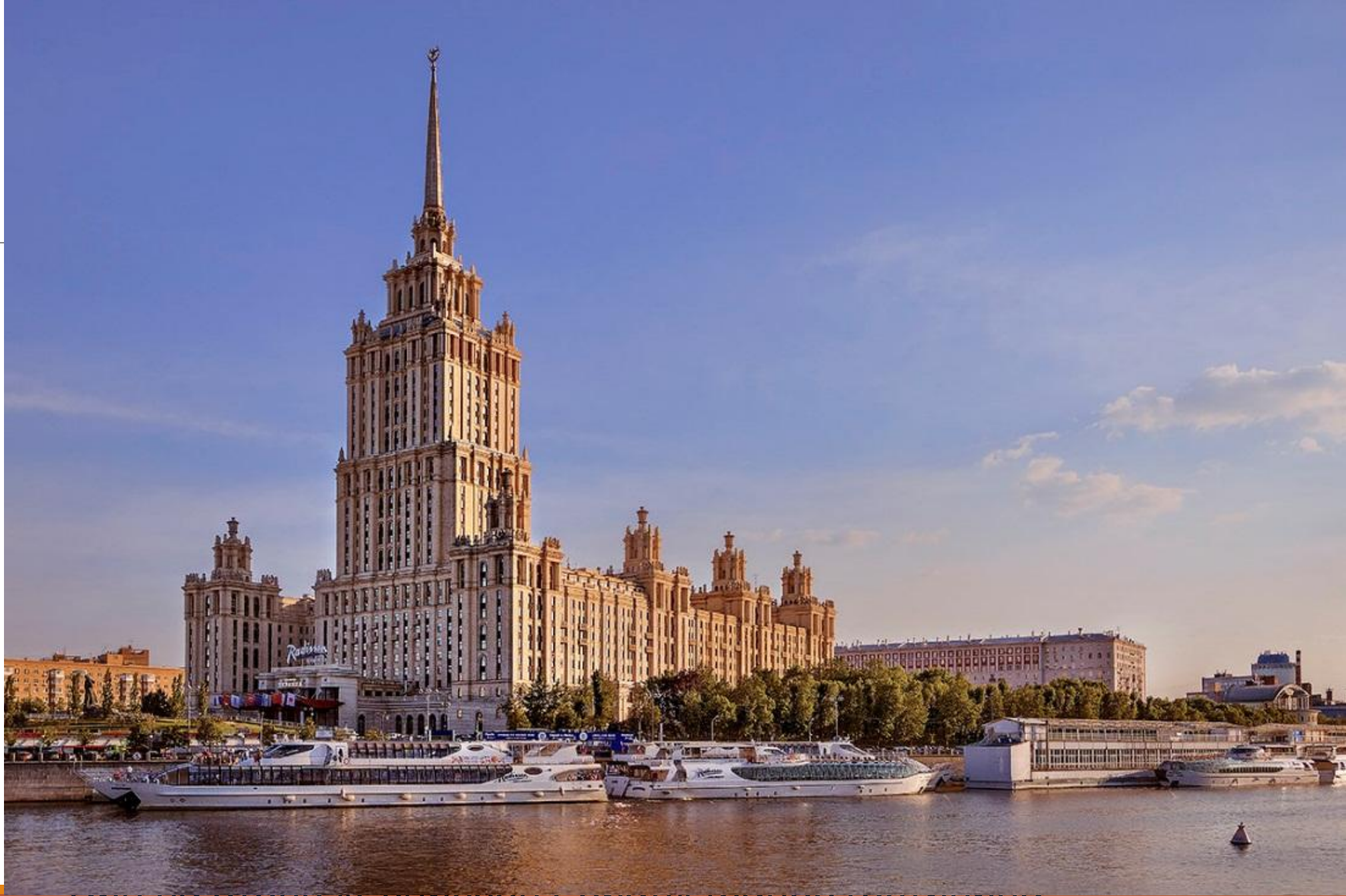
Вид на отель «Украина» (ранее гостиница «Украина»), Москва