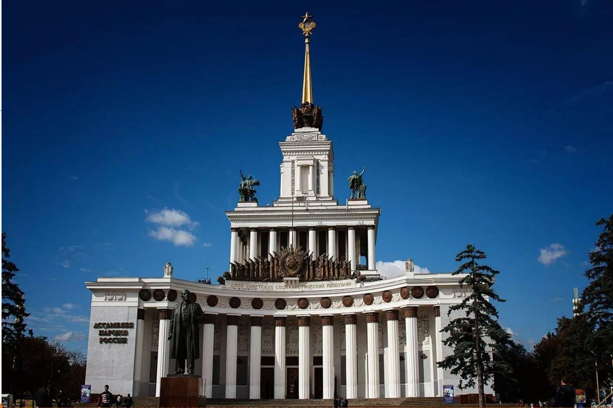
Главный палаточный центр, Москва