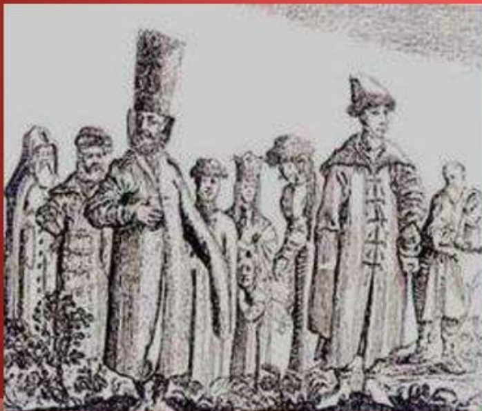
Рис. внизу: Московские бояре. (Гравюра XVI в.)

Рис. вверху: Королевич Владислав. (Гравюра XVII в.)