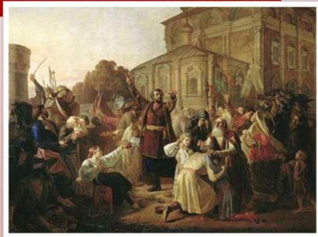
М. И. Песков. Воззвание Минина к нижегородцам в 1611 г.