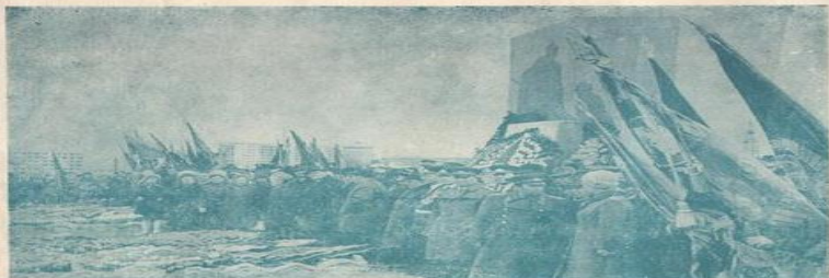
НА СНИМКЕ: трудящиеся города Абакана на братской могиле у памятника воинам Советской Армии, умершим от ран в госпиталях города в период Великой Отечественной войны.