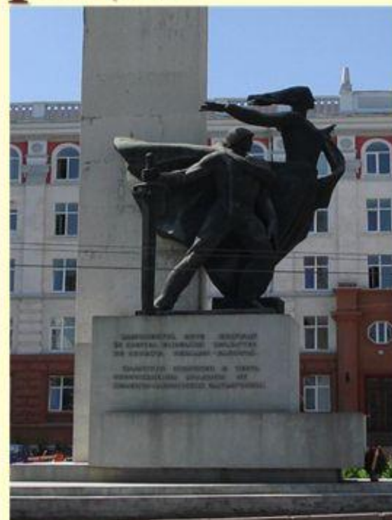
Памятник в честь освобождения Молдавии в центре Кишинёва