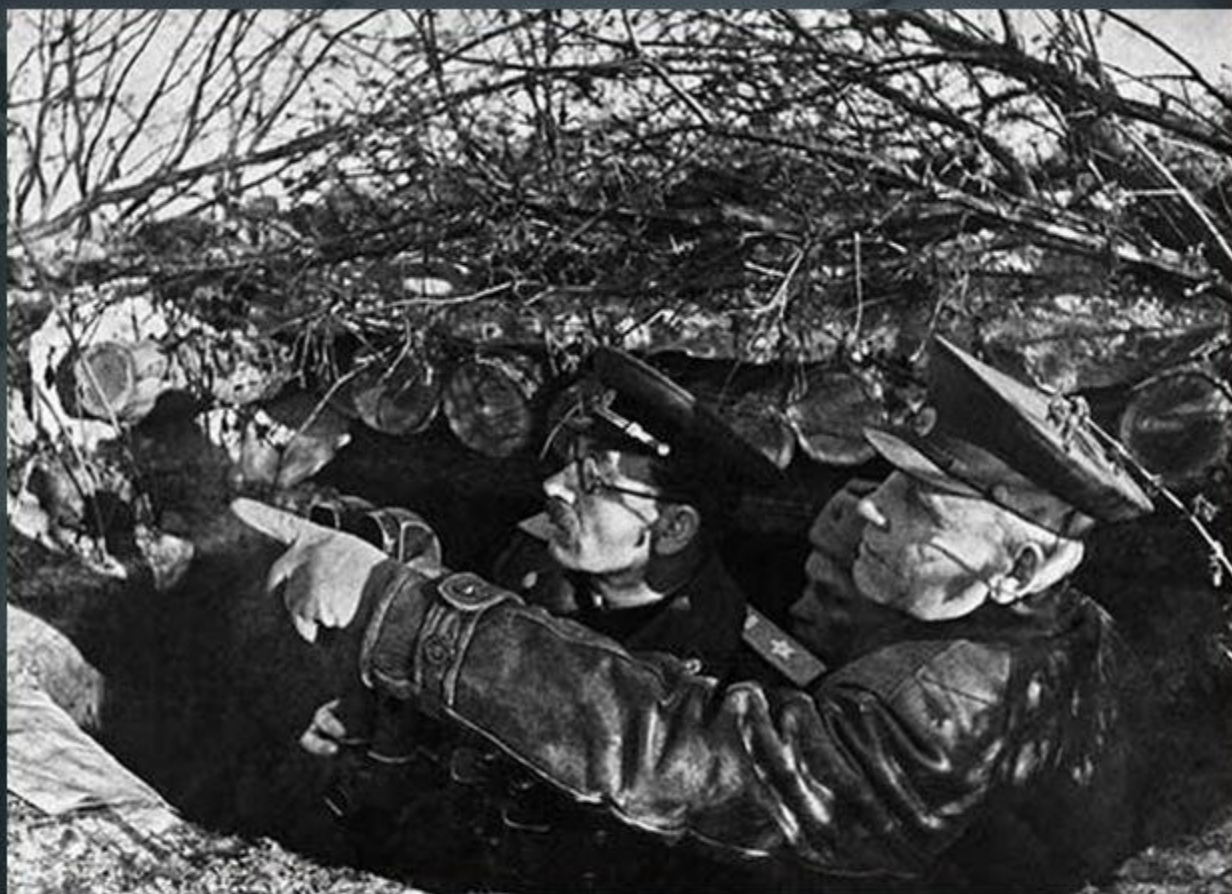
И.С. Конев и П.С. Ротмистров на наблюдательном пункте в ходе Корсунь-Шевченковской наступательной операции. Зима 1944 г.