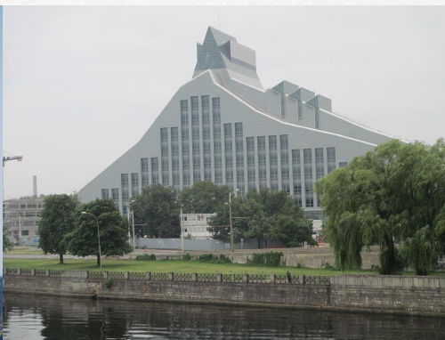
Latvijas nacionālā bibliotēka