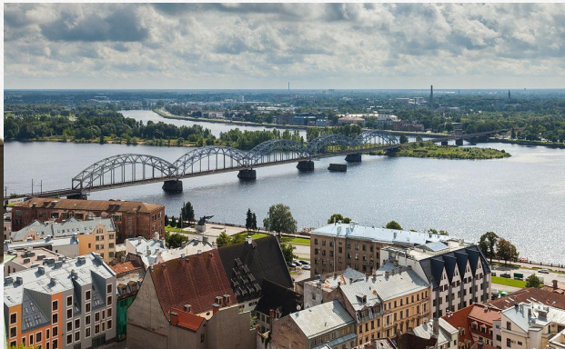
Dzelzceļa tilts caur Daugavu. Ж/Д мост через Даугава