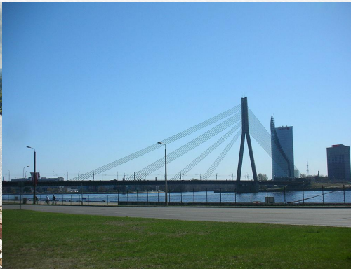
Vanšu tilts. Вантовый мост.