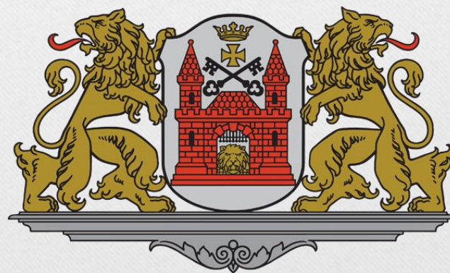
Rīgas ģerbonis. Герб Риги.