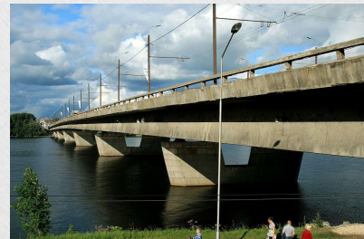
Salu tilts. Островной мост.