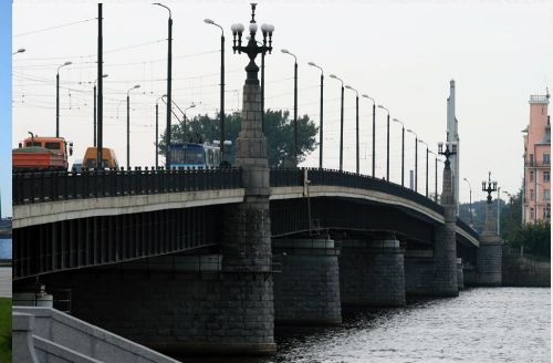
Akmens tilts. Каменный мост.