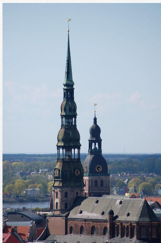
Sv. Pētera baznīca. Церковь св. Петра