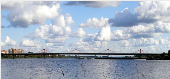
Dienvidu tilts. Южный мост.