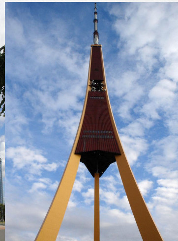
Rīgas teletornis. Рижская телебашня