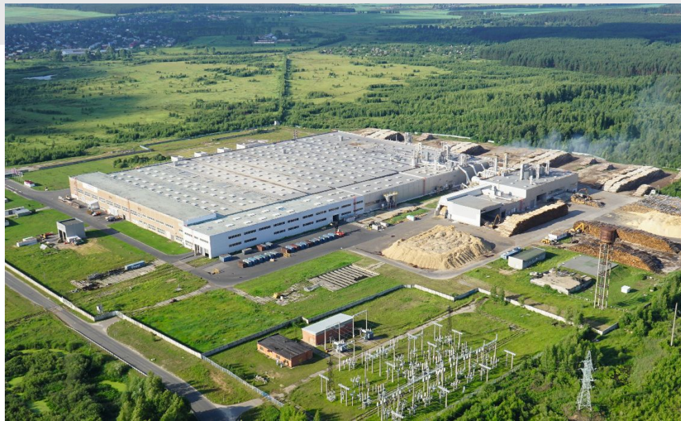
Завод EGGER в г. Шуя