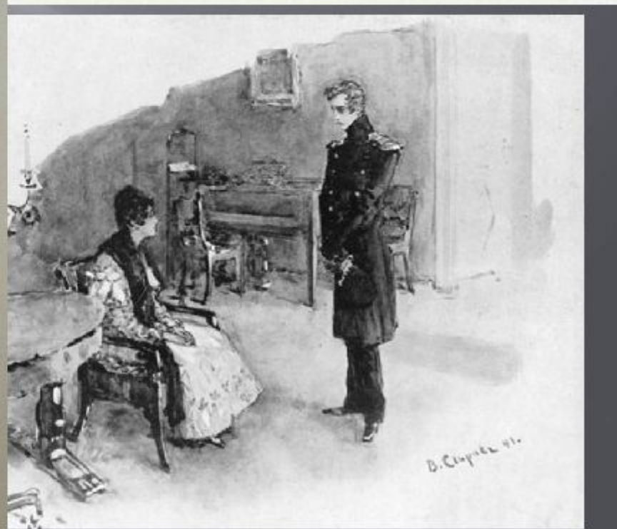
Княжна Мери. Иллюстрация В. Серова к роману «Герой нашего времени»