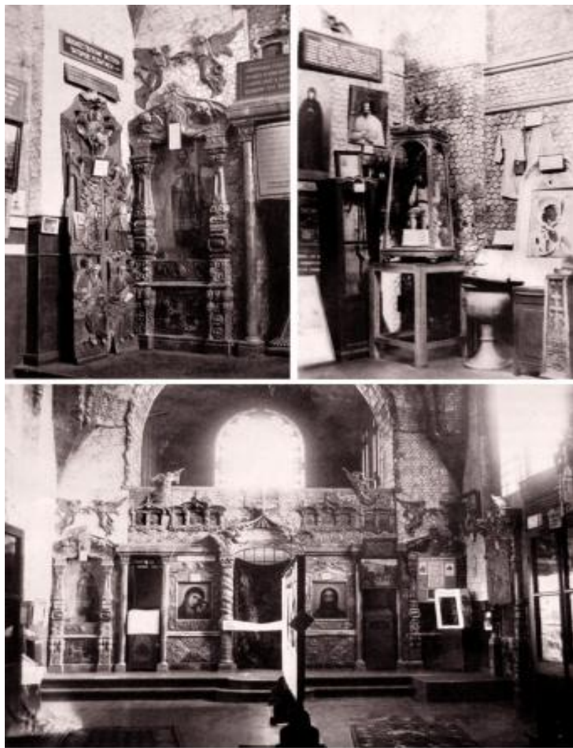
Экспозиция антирелигиозного музея в Великокняжеской церкви. Фото 1930-х гг.