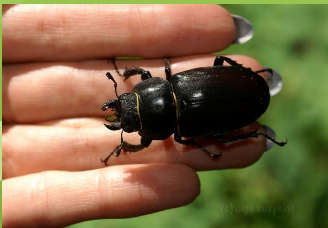
Самка (40-42 мм)

Жук-олень, або жук-рогач, є самим найбільшим жуком Європи.