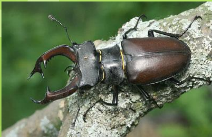
Самець (75-80 мм)