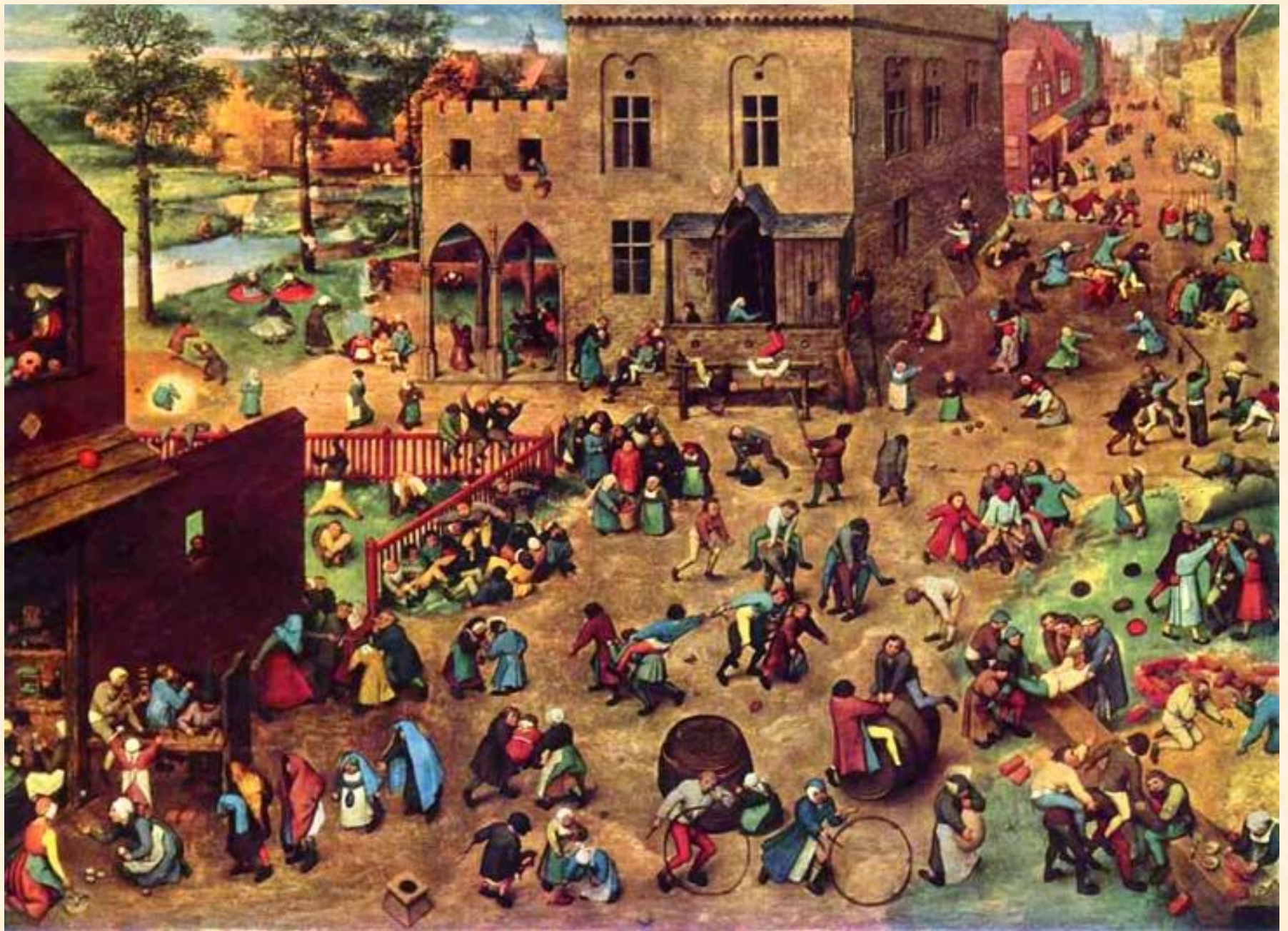
Игры детей. Брейгель