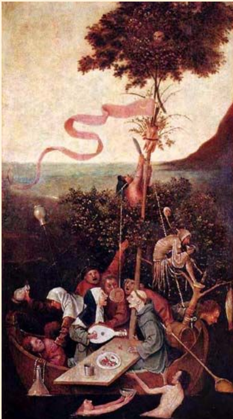
Корабль дураков. Босх