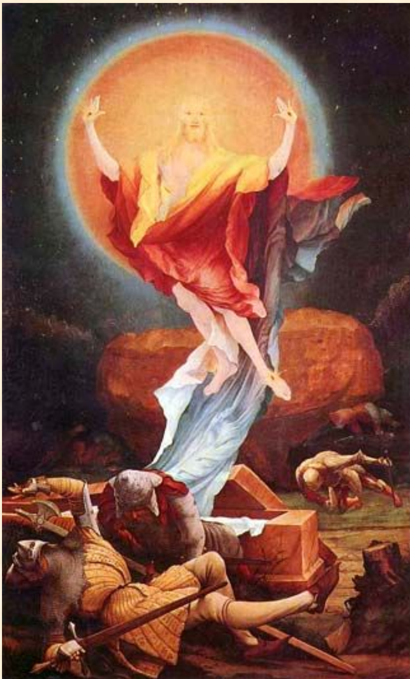
Воскресение Христа. Грюневальд