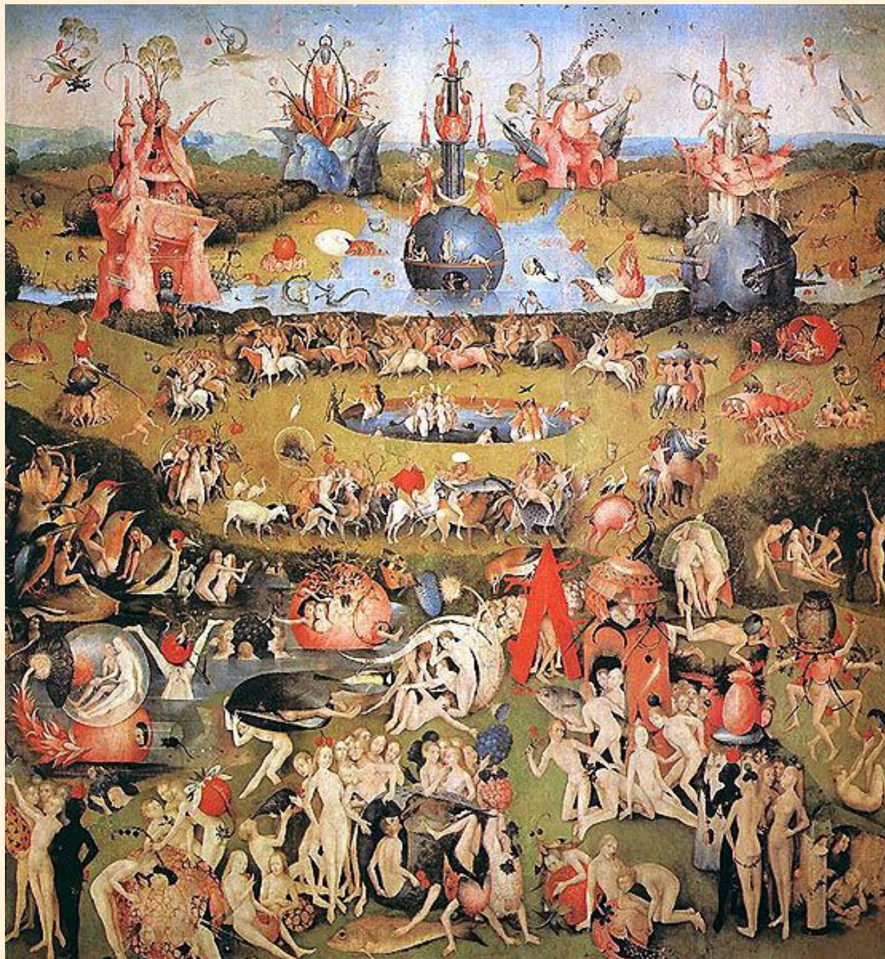
Сад земных наслаждений. Босх