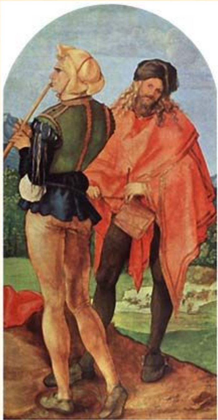
Барабаник и флейтист. Дюрер