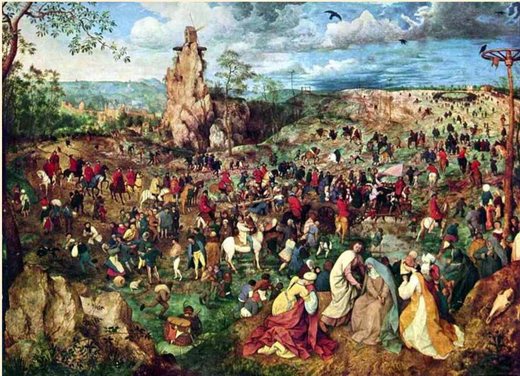
Несение креста. Брейгель