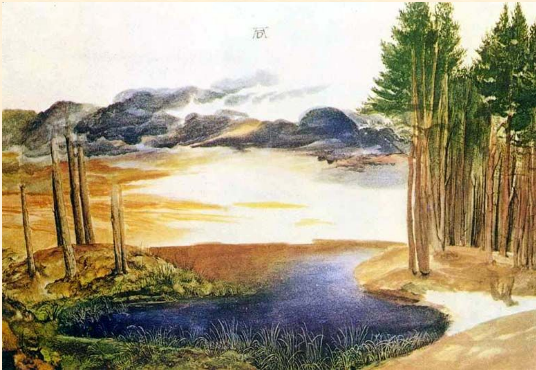
Лесной пруд. Дюрер