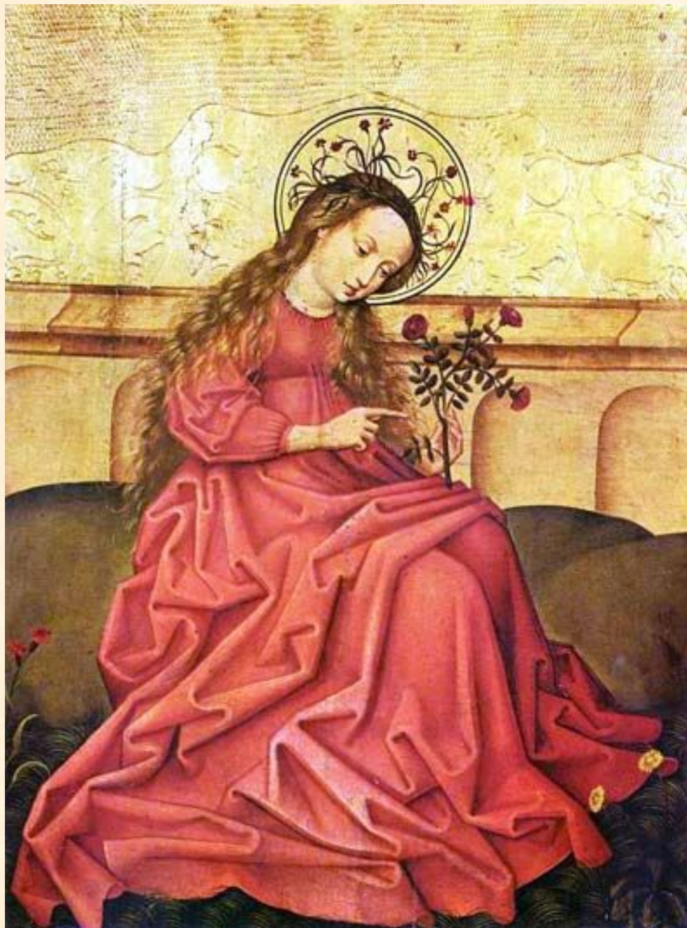
Мадонна в саду. Грюневальд