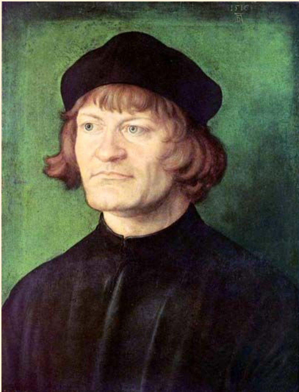
Портрет священника. Дюрер