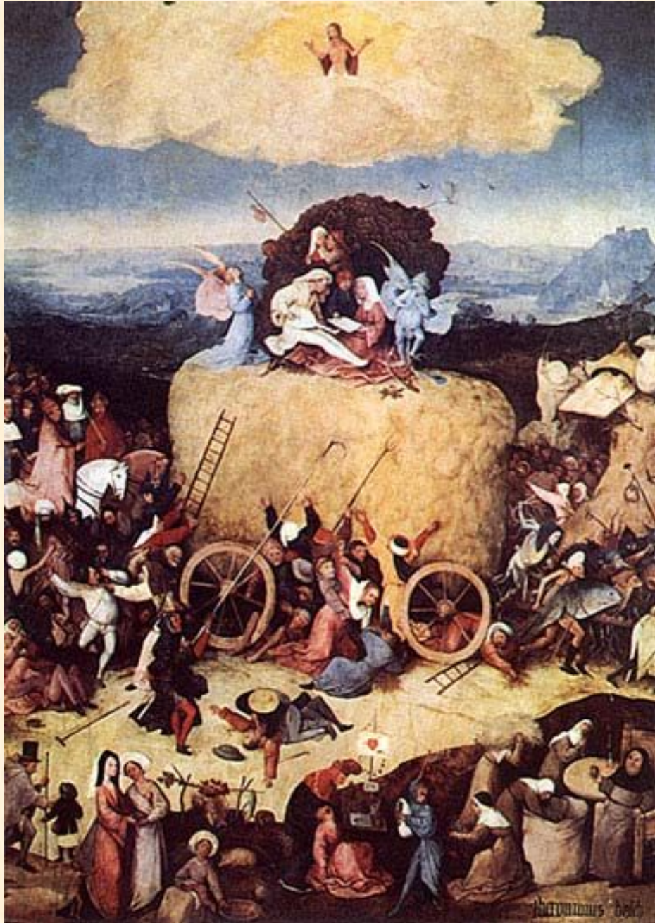
Воз сена. Босх