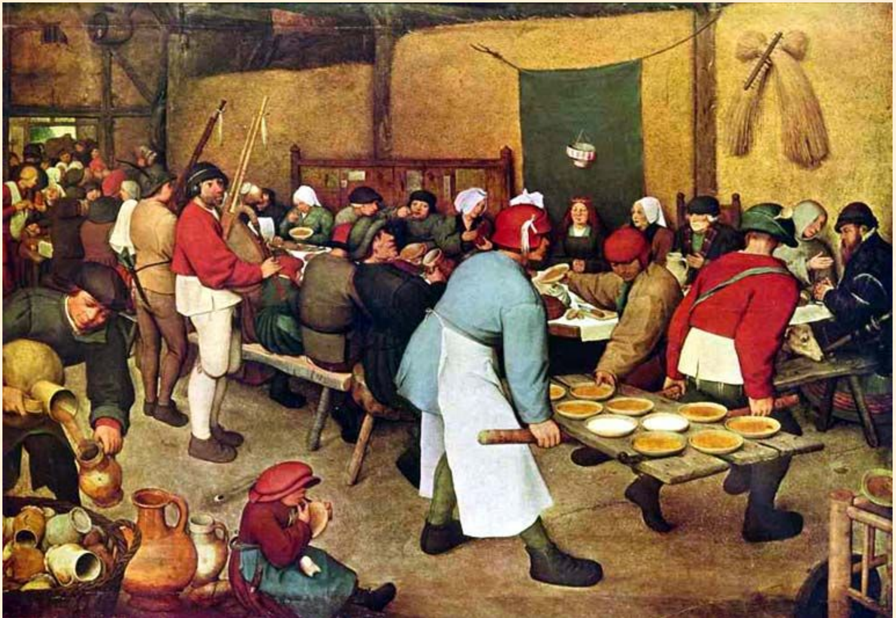
Крестьянская свадьба. Брейгель