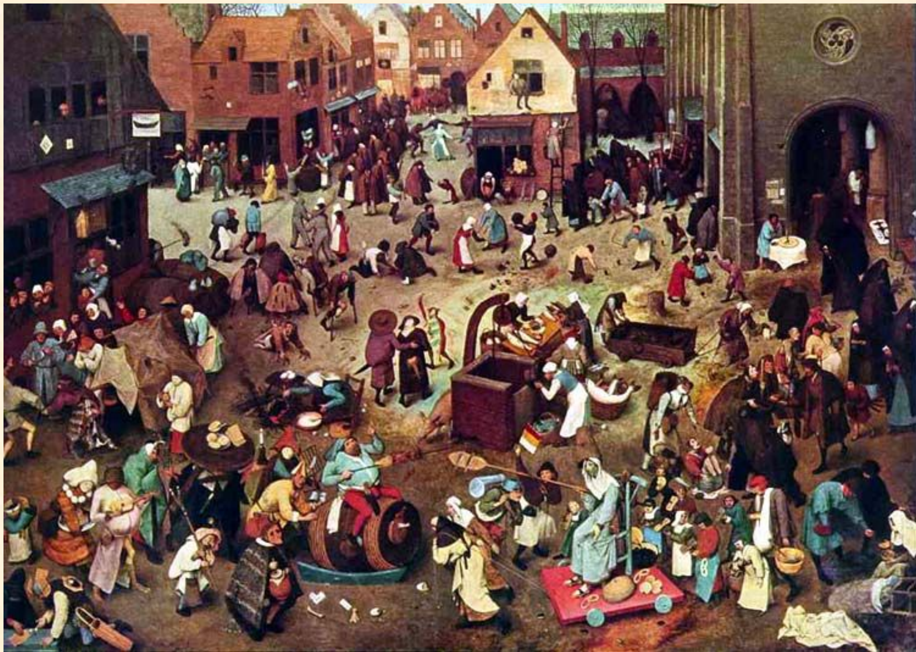
Битва поста и масленицы. Брейгель