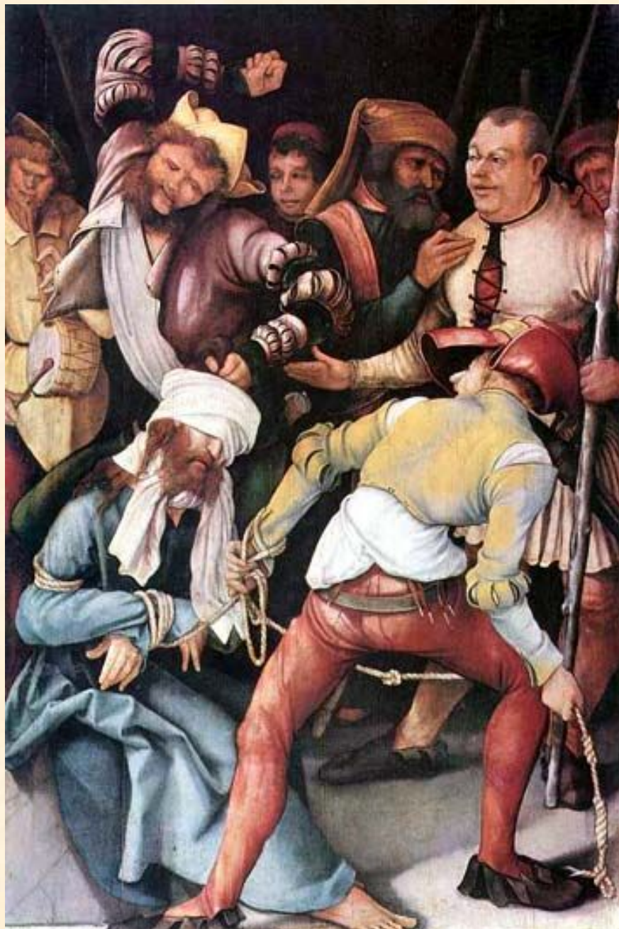
Осмеяние Христа. Грюневальд