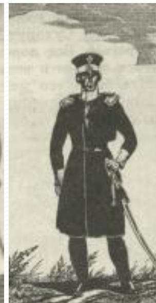
Обер-офицер Симбирского ополчения.