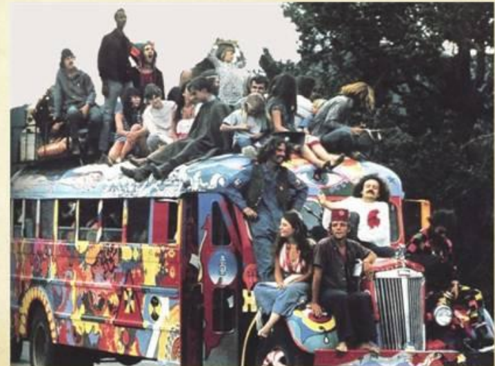
Молодежная революция в 60ых