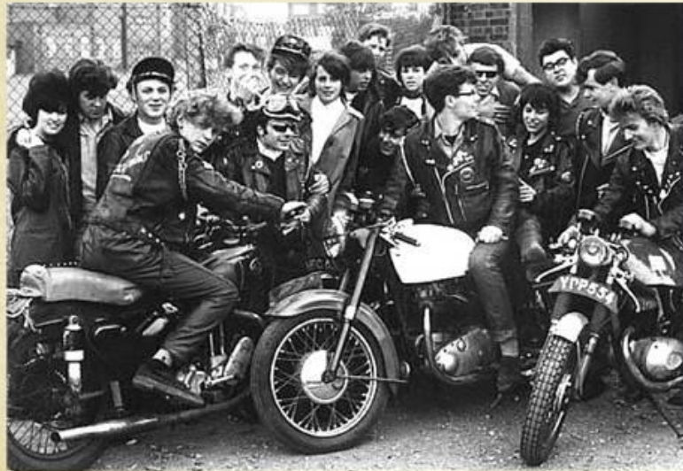
Английские рокеры 50ых