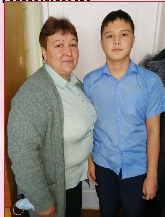
Я, учусь в 8 классе