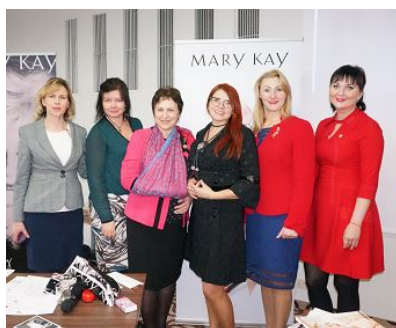
В Конференции из нашей Бизнес-Группы участвовали Консультанты из Риги, Прейли, Валмиеры, Сигулды.