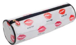
3-й КВАРТАЛ Целовательный пенал Mary Kay®

Консультант систематически совершенствует свое умение продавать, учится предлагать возможности карьеры в Mary Kay и коллекционирует прекрасные призы!