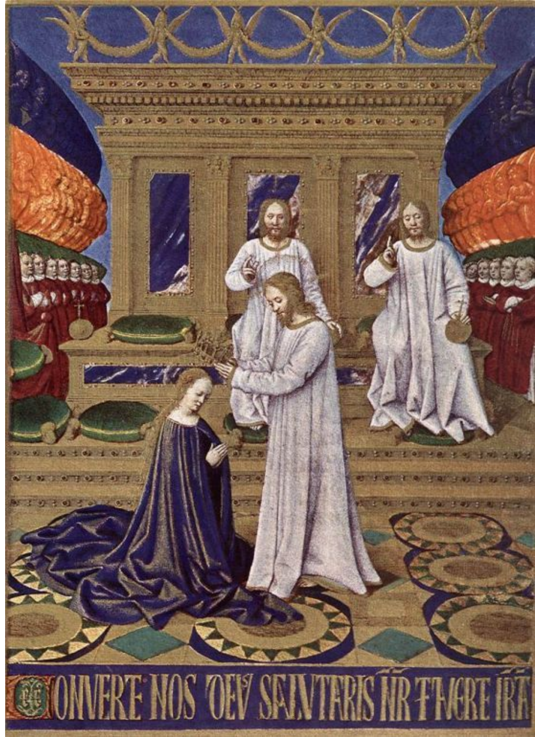
«Иудейские древности VII»