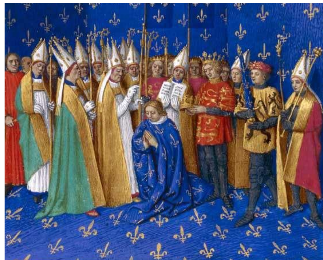
«Коронация Филиппа II Августа»