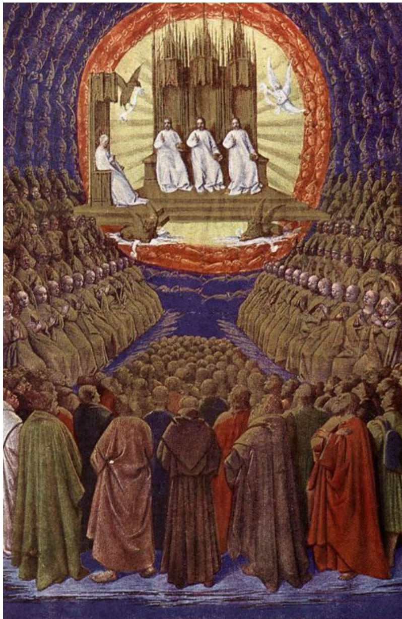
«Иудейские древности VIII»