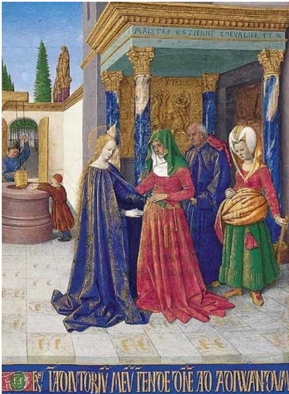
«Встреча Девы Марии и Елизаветы»