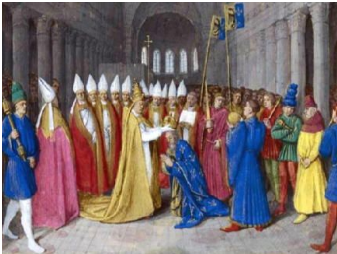
«Коронация Карла Великого»