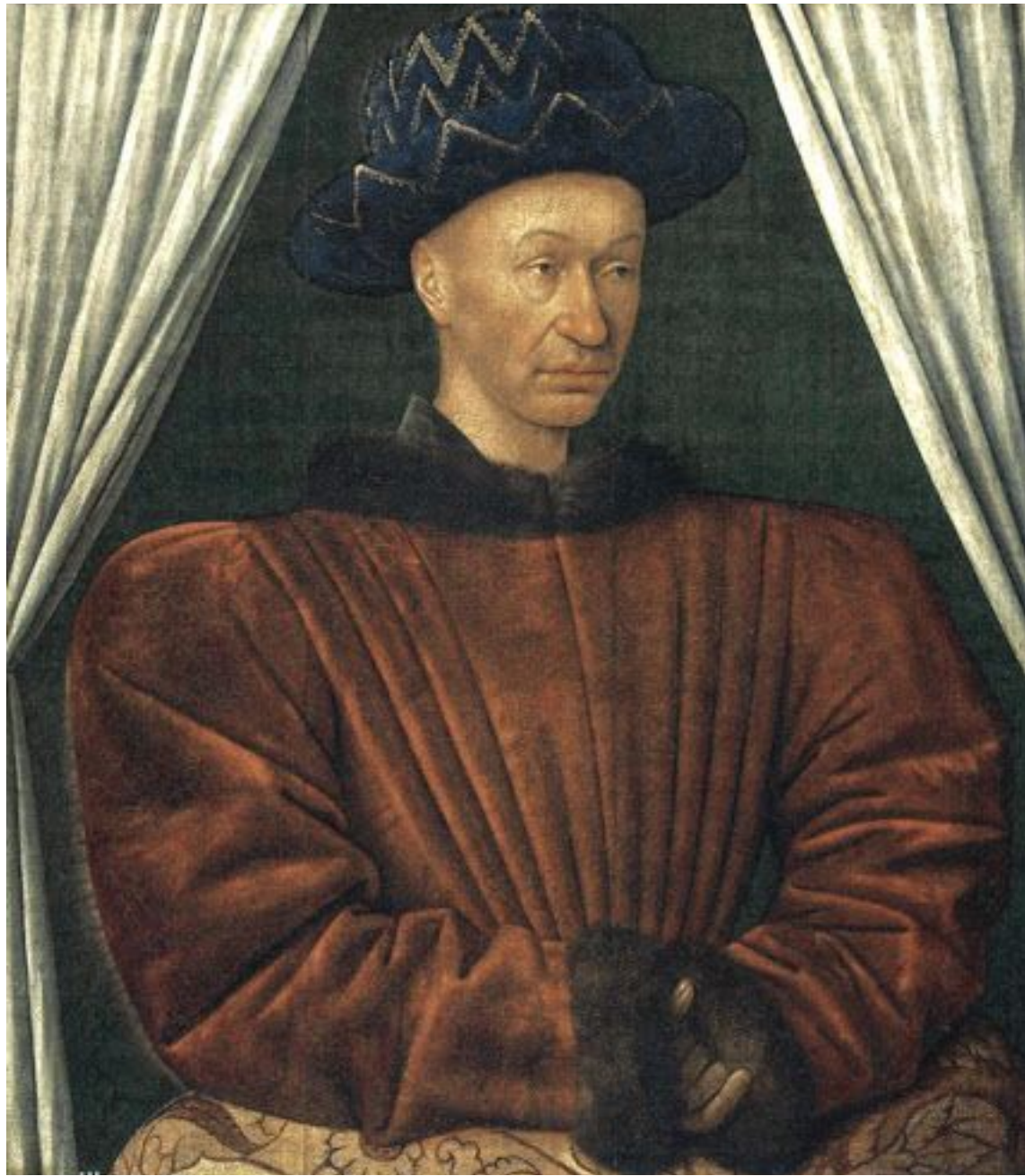
«Портрет Карла VII»