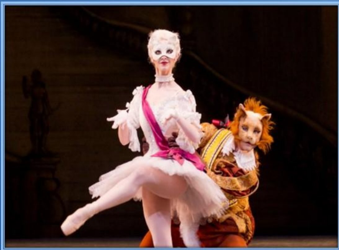
«Кот в сапогах»