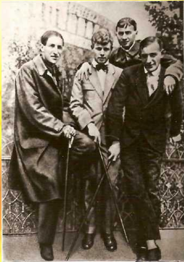
С. А. Есенин среди имажинистов.