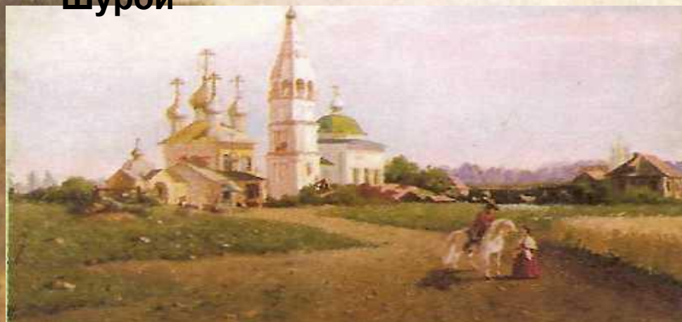
Окрестности села Константиново