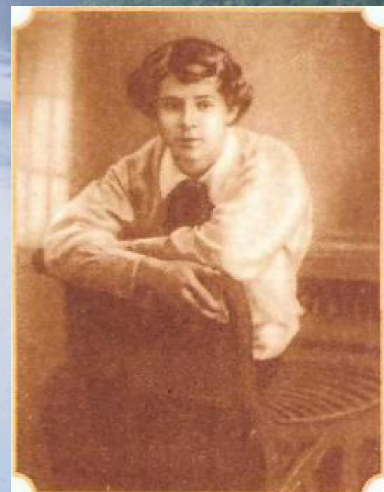
С.Есенин 1913—14 год