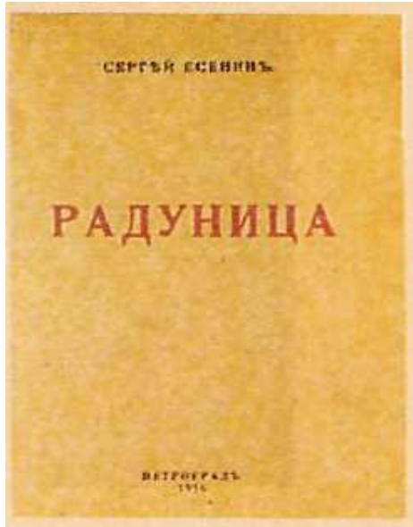
С. Есенин. Обложка. «Радунца», 1916г.

В начале 1916 года выходит первая книга «Радунца», в которую входят стихи, написанные Есениным в 1910-1915 годах. Есенин позже признавался: «Моя лирика жива одной большой любовью, любовью к родине. Чувство родины - основное в моем творчестве». Книга пропитана фольклорной поэтикой (песня, духовный стих), ее язык обнаруживает немало областных, местных слов и выражений, что тоже составляет