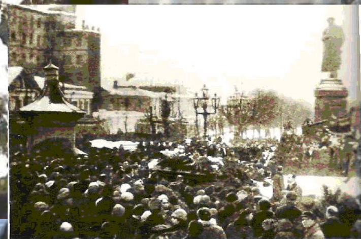
Похоронная процессия у памятника Пушкину. Москва