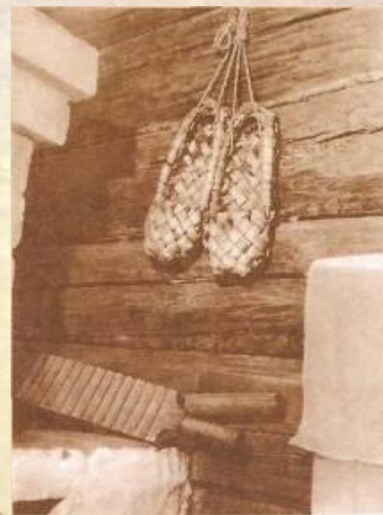
Интерьер дома- музея