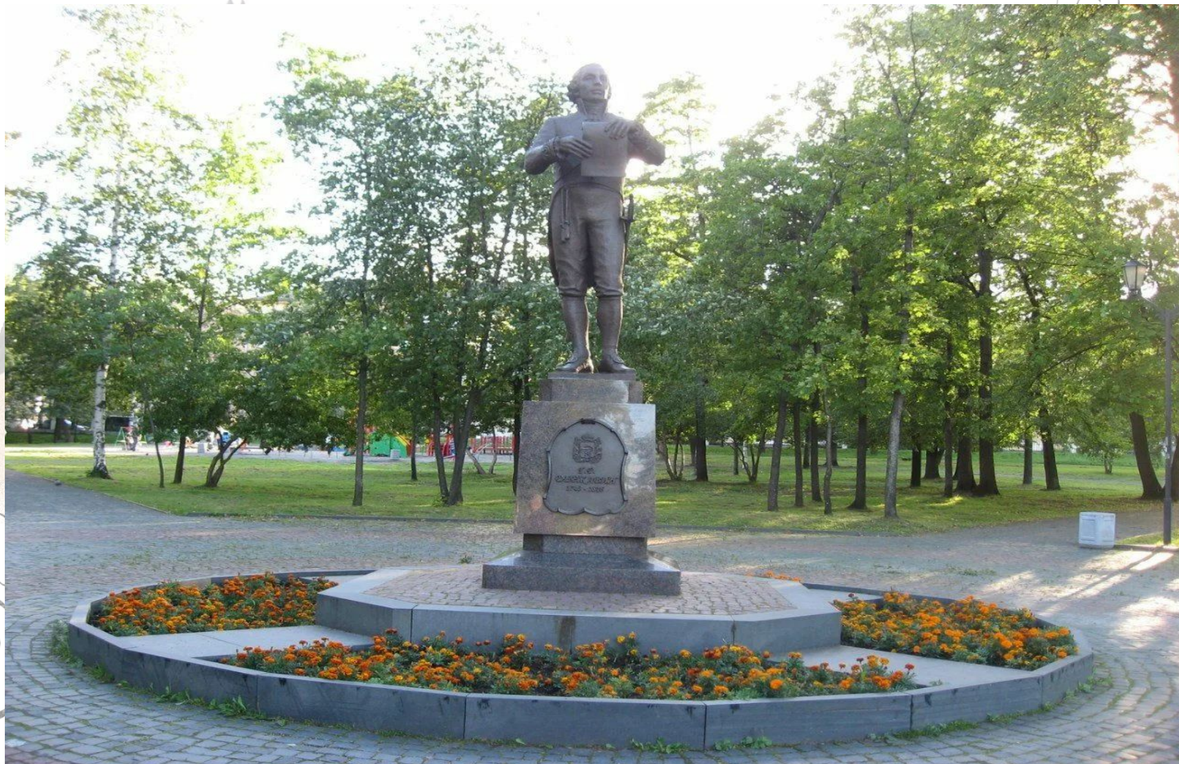
Памятник Г. Р. Державину в г. Петрозаводске