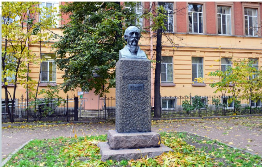
Памятник Некрасову перед домом на Литейном проспекте, 36