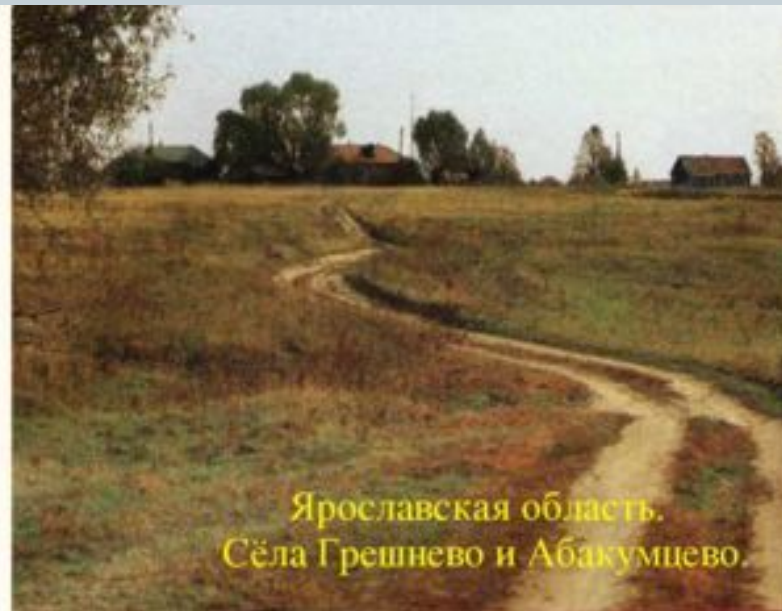
Ярославская область. Сёла Грешнево и Абакумцево.