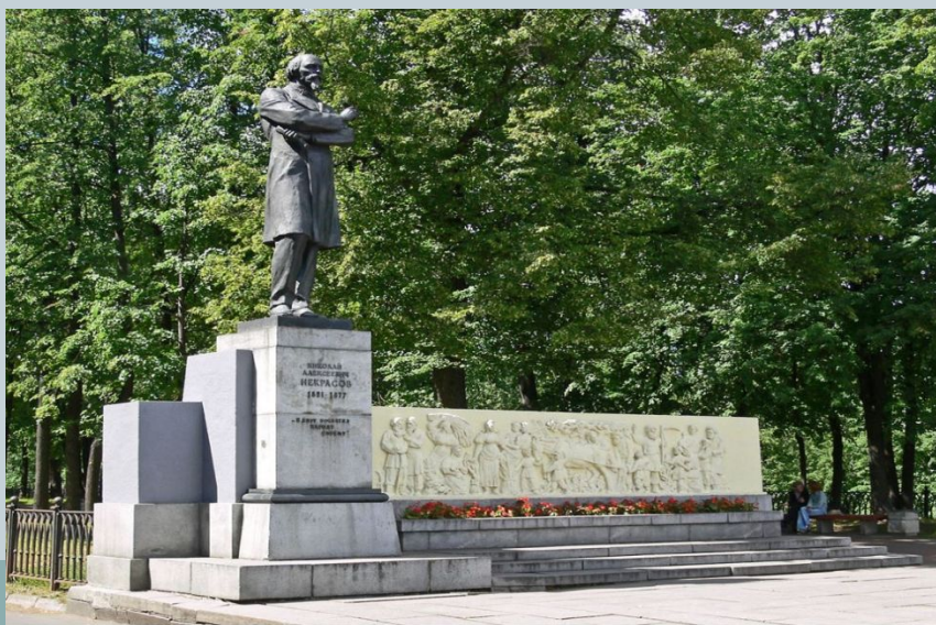
Памятник Некрасову в Ярославле