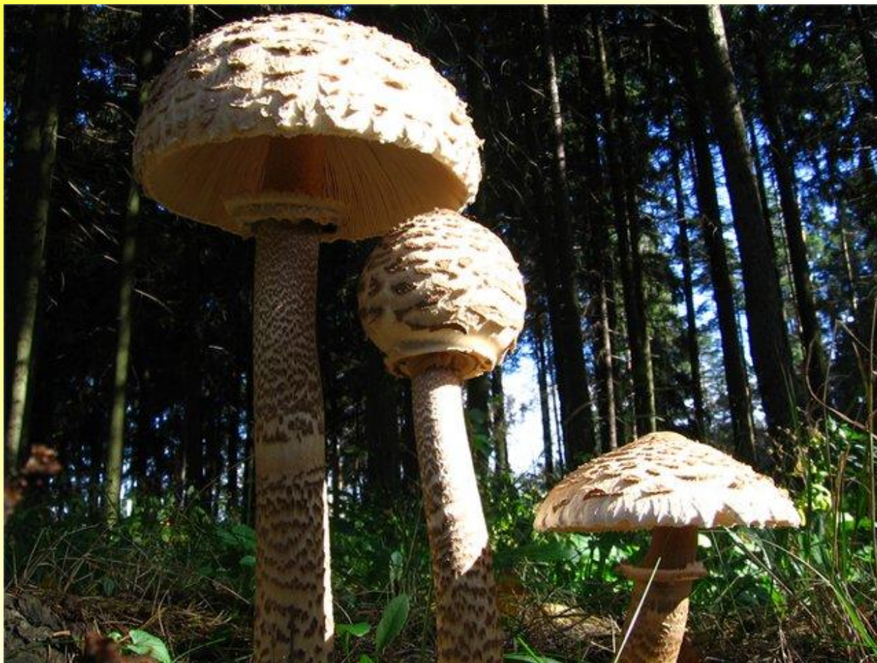
Гриб - зонтик