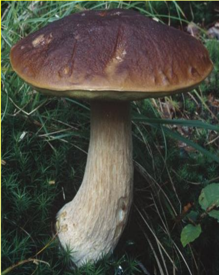
Белый дубовый гриб

Белый гриб издавна славился своими лечебными свойствами.