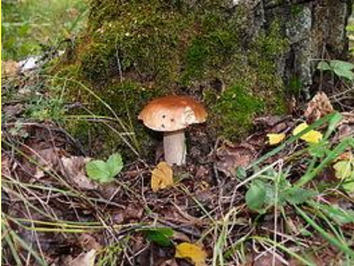
Белый гриб берёзовый