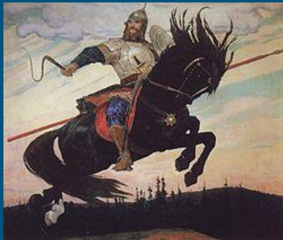
“Богатырский скак” М.В.Васнецов