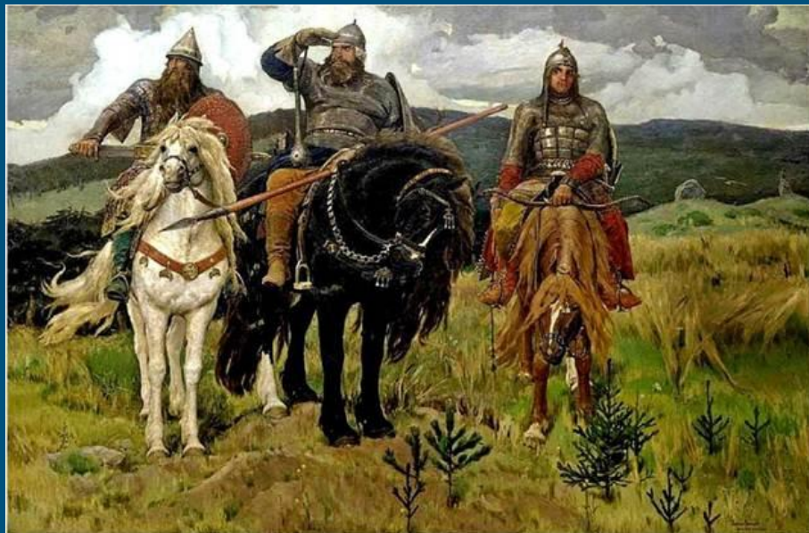
В.М.Васнецов “Три богатыря”

Изображение не всей древнерусской дружины, а отдельных воинов богатырей, побеждающих несметное полчище врагов