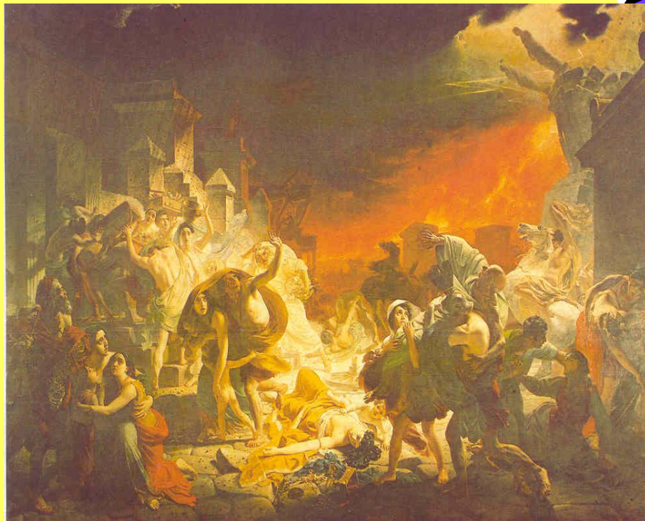
К. Брюллов. Последний день Помпеи.

Исторический жанр – это жанр, объединяющий произведения изобразительного искусства, в которых запечатлены значительные события и герои прошлого, различные эпизоды из истории отдельной страны.