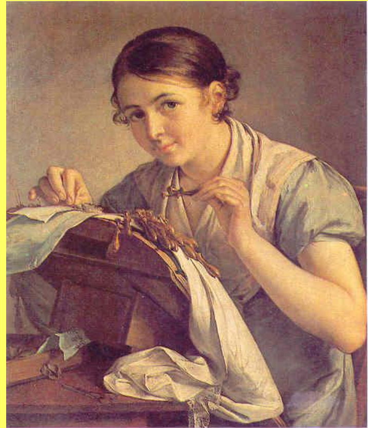
В. Тропинин. Кружевница.

Портрет - один из самых распространенных жанров изобразительного искусства, причем на картине могут быть изображены один или несколько человек.