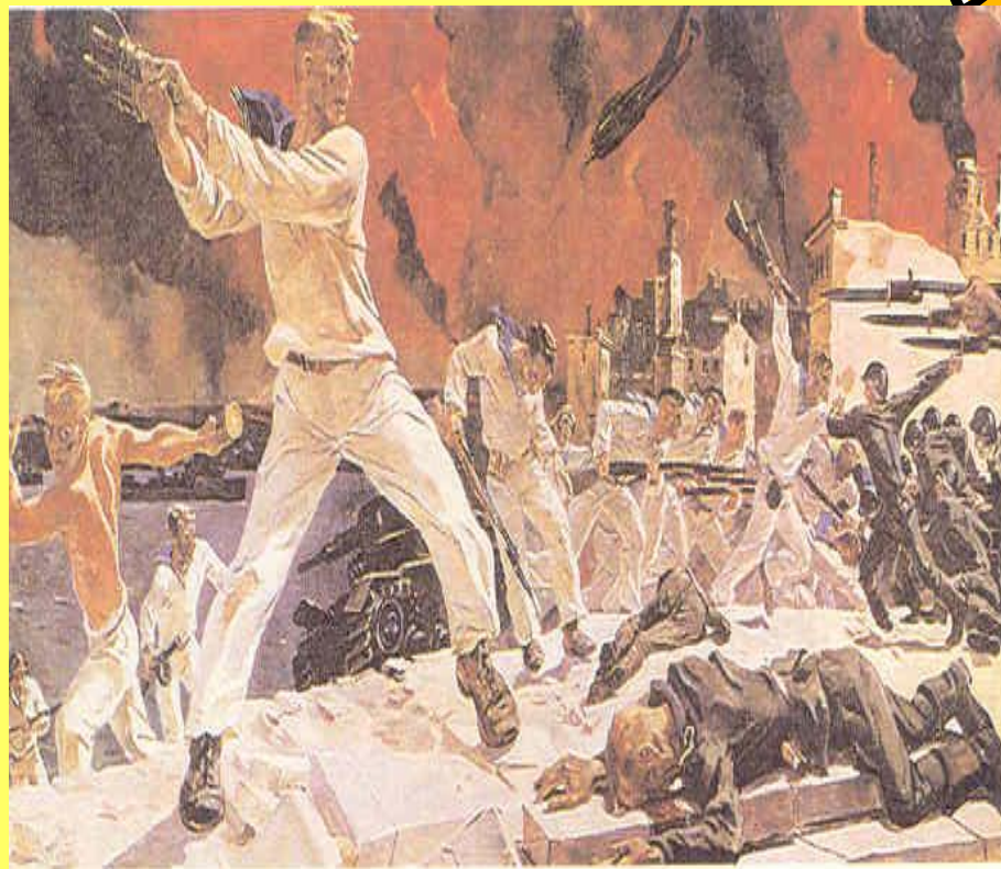
А. Дейнека. Оборона Севастополя.

Батальный жанр - жанр изобразительного искусства, посвященный темам войны и военной жизни. Главное место в батальном жанре занимают сцены военных сражений и походов.