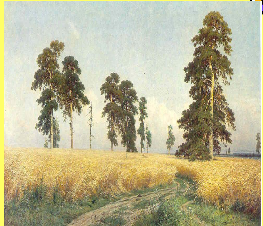
И. Шишкин. Рожь.

Пейзаж - жанр изобразительного искусства, посвященный воспроизведению естественной или преобразенной человеком природы.