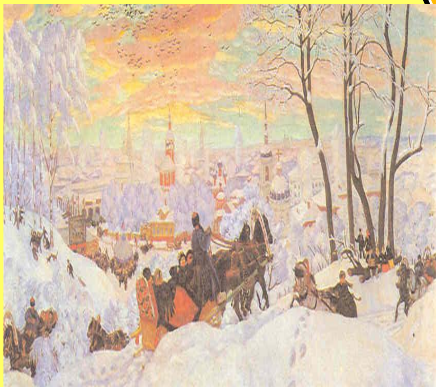
В. Кустодиев. Масленица.

Бытовой жанр - это изображение жизни людей, их труда, событий в окружающей действительности.