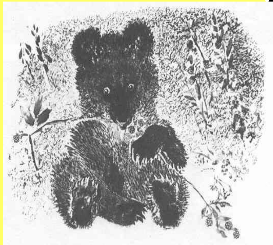
Е. Чарушин. Медвежонок.

Анималистический жанр - жанр изобразительного искусства, посвященный изображению животного мира.