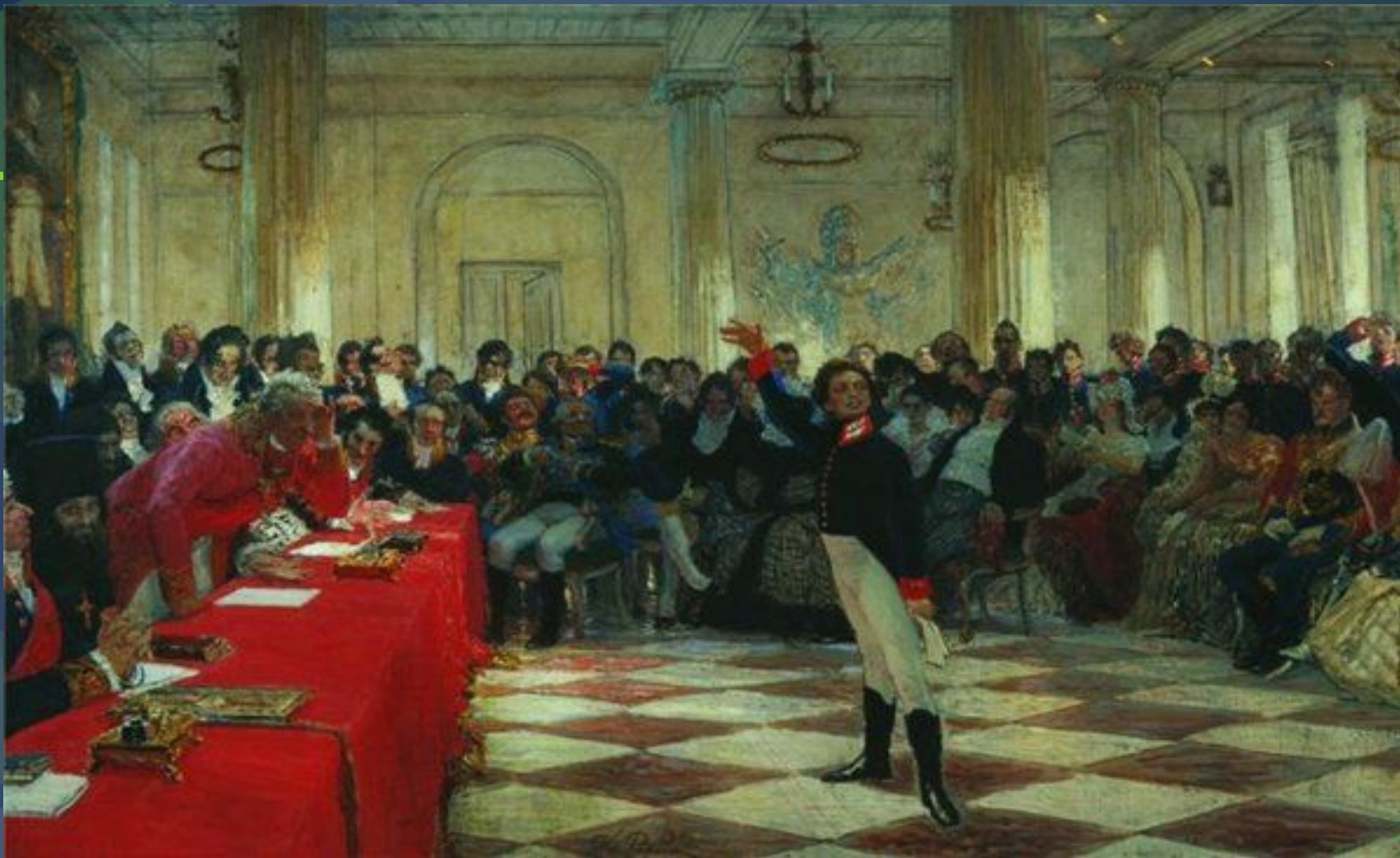
Илья Репин «Пушкин на лицейском акте»