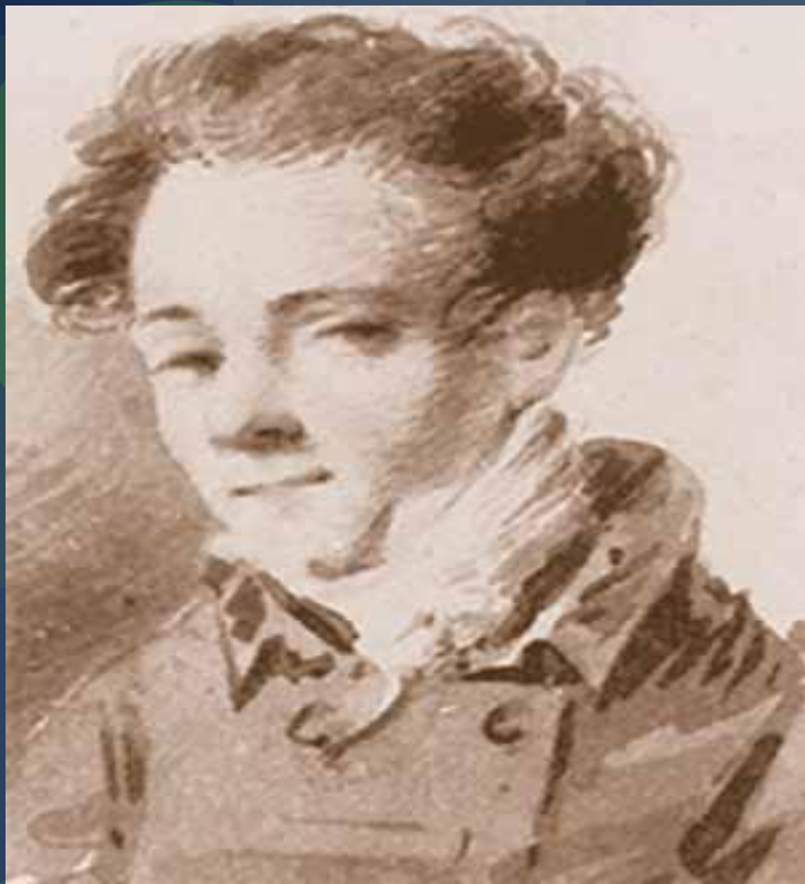
Дельви́г Анто́н, 13 лет. Прозвище «Тося»

Бли́зкий дру́г Пуш́кина. Созда́тель альмана́ха «Се́верные цве́ты»