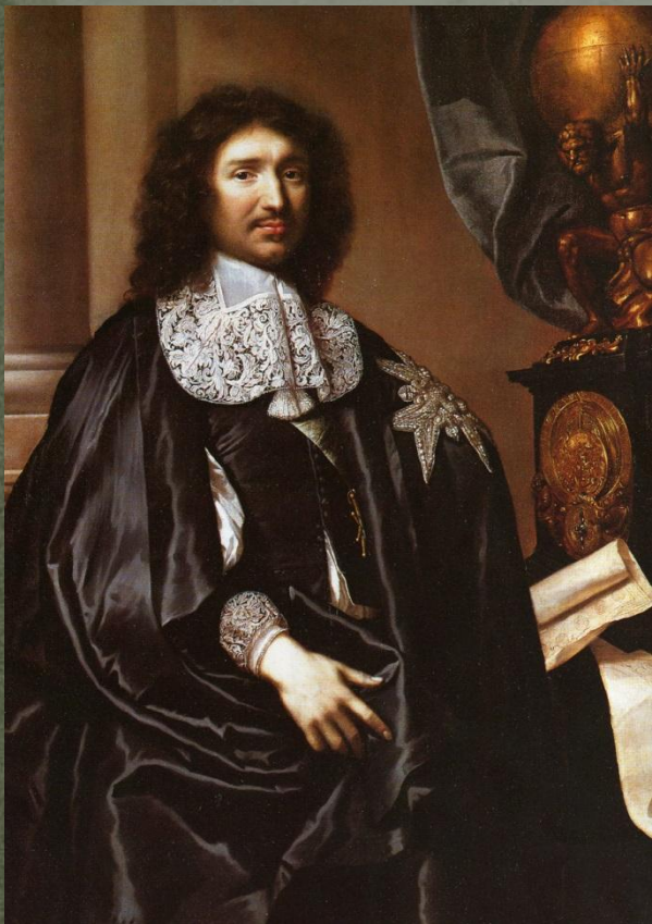
Жан-Батист Кольбер (министр финансов)