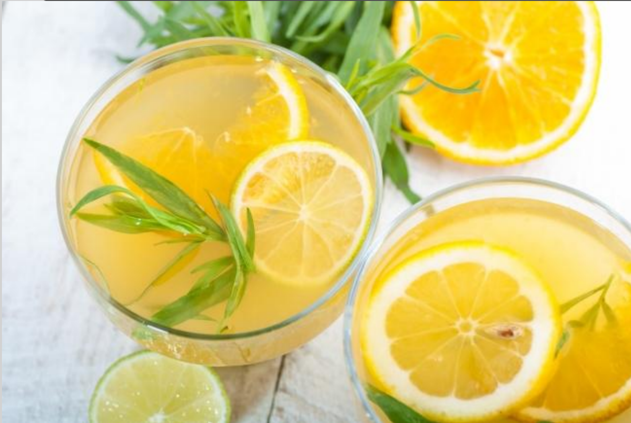
Оранжед з тархуном